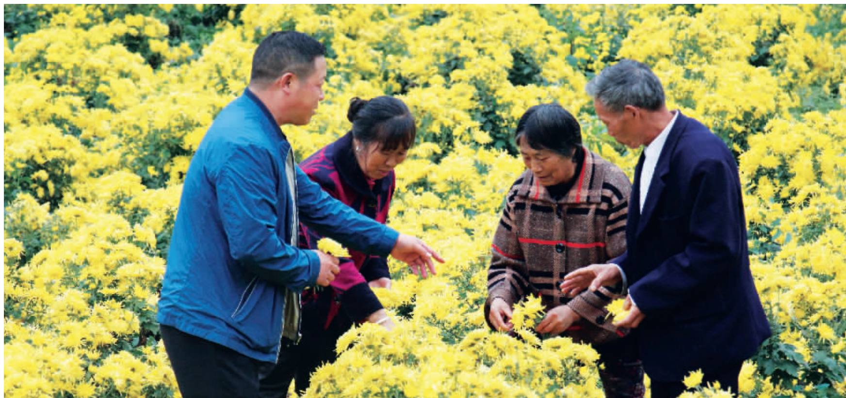
小沟村村民在采摘种植的菊花。