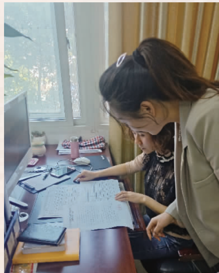
市残联工作人员按照《监察建议书任务分解表》,核对整改措施。