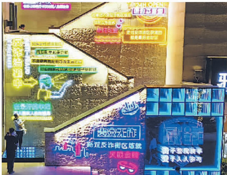
游客在贵安反诈主题街区观看反诈宣传标语。