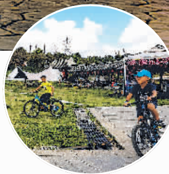
▲孩子们在贵安新区车田村骑行。

以“庆中秋·迎国庆”为主题举行文艺活动,让广大群众在欢乐的氛围中欢度中秋、国庆佳节。