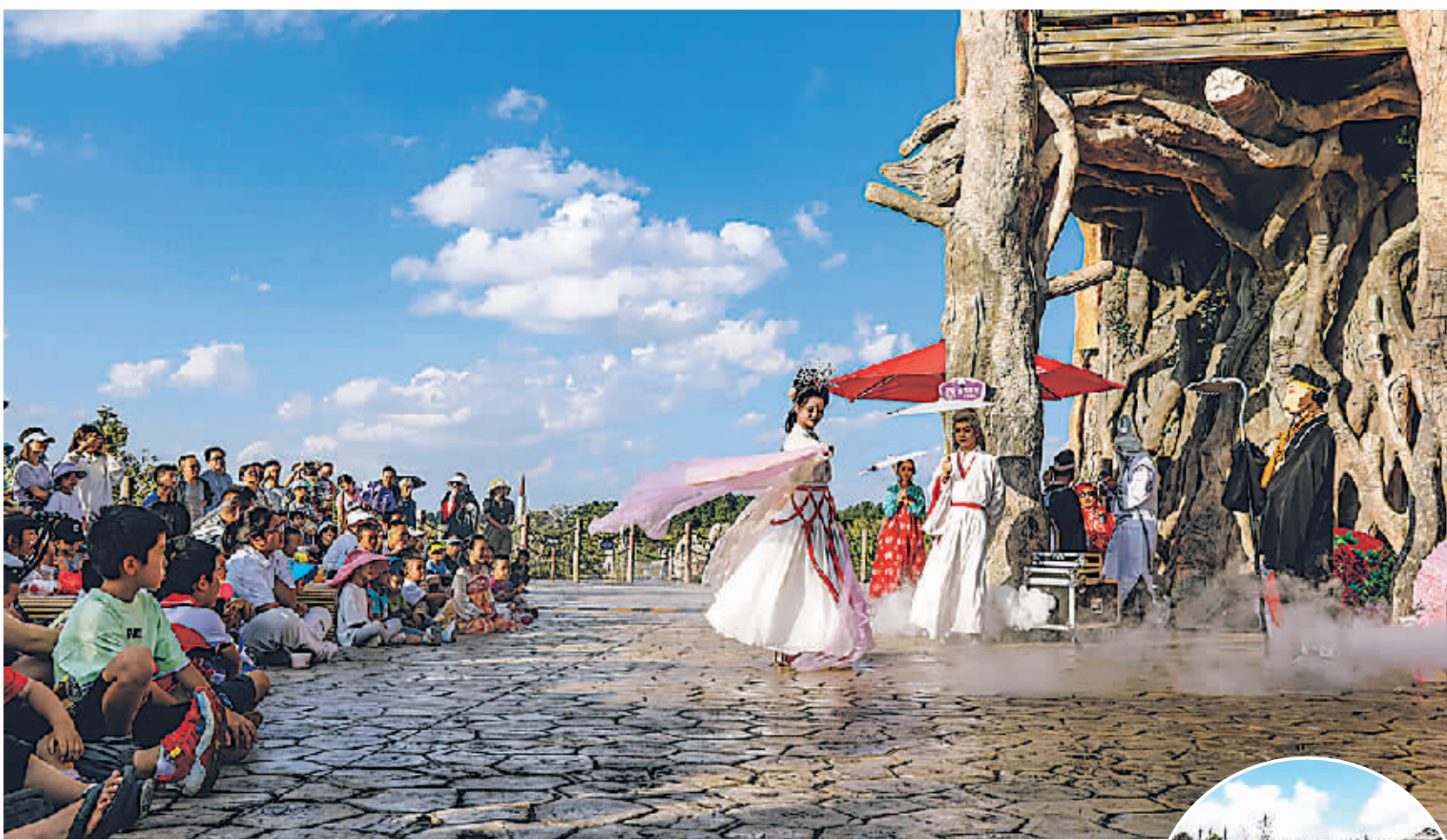
▲贵安云漫湖大型神话游园会活动上演,精彩节目吸引众多游客观赏。

本报讯 中秋国庆假期,贵安新区各乡镇(街道)及旅游景区开展丰富多样的节庆活动,吸引不少游客前往。据统计显示,“双节”期间,贵安新区接待游客13万人次,实现旅游收入6400万元。