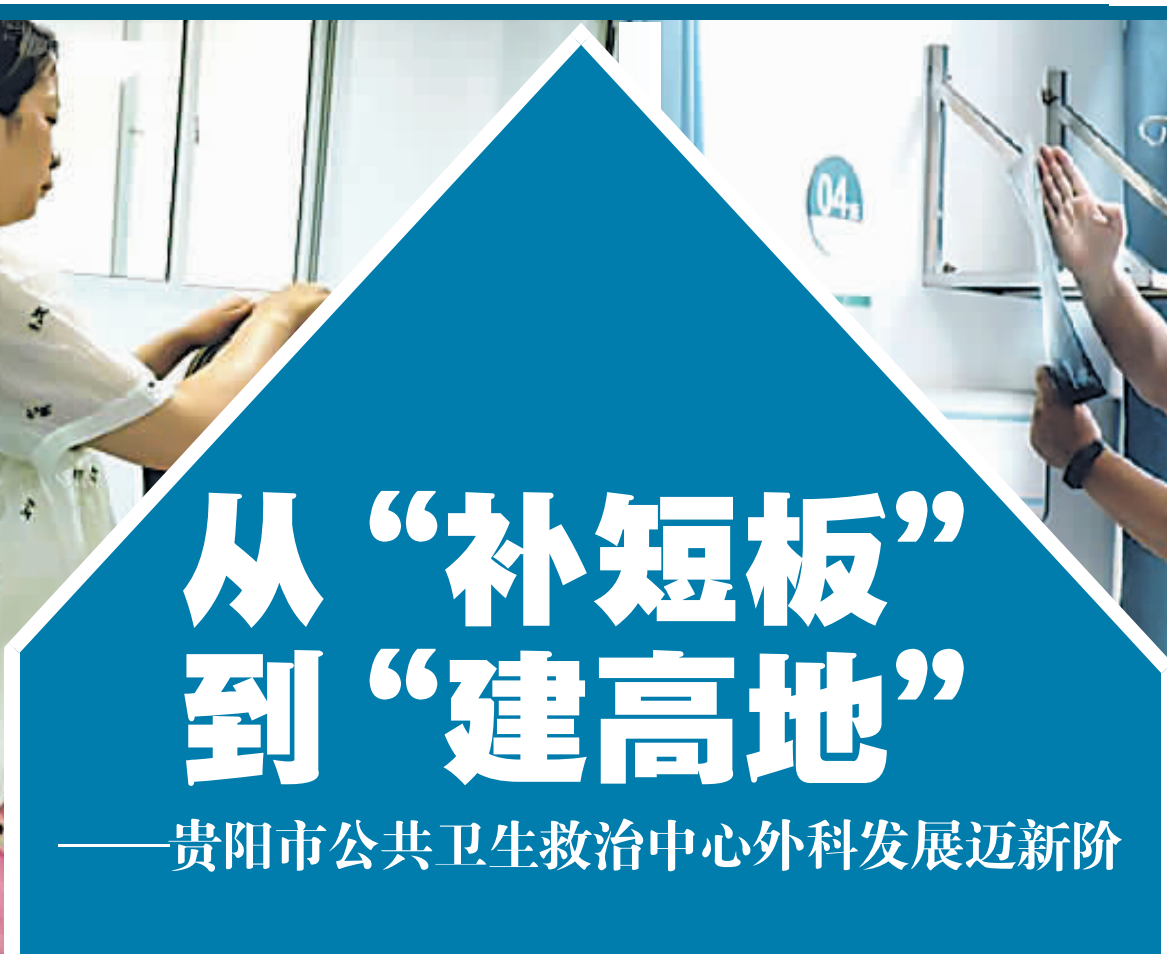
骨科主任及医护人员在认真查房。