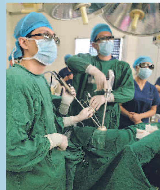
▲胸外科医生为患者进行3D胸腔镜辅助下单孔微创肺叶切除术。