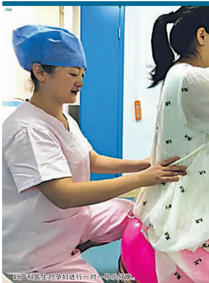
妇产科医生对孕妇进行一对一导尿分娩。