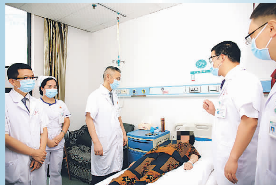
▲泌尿外科主任及医护人员在认真查房。

从无到有、从有到精。贵阳市公卫中心外科学科建设已进入快车道,亮眼的“成绩单”背后,是医院外科诊疗技术的精益求精,是以拿得出疗效为目标,不断突破自我,为群众健康保驾护航的决心。