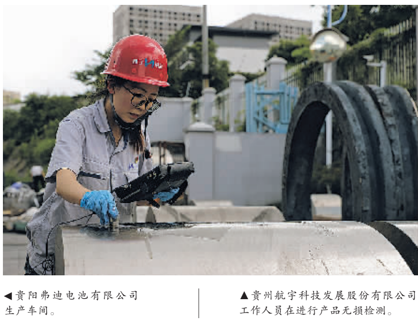
▲贵阳弗迪电池有限公司生产车间。