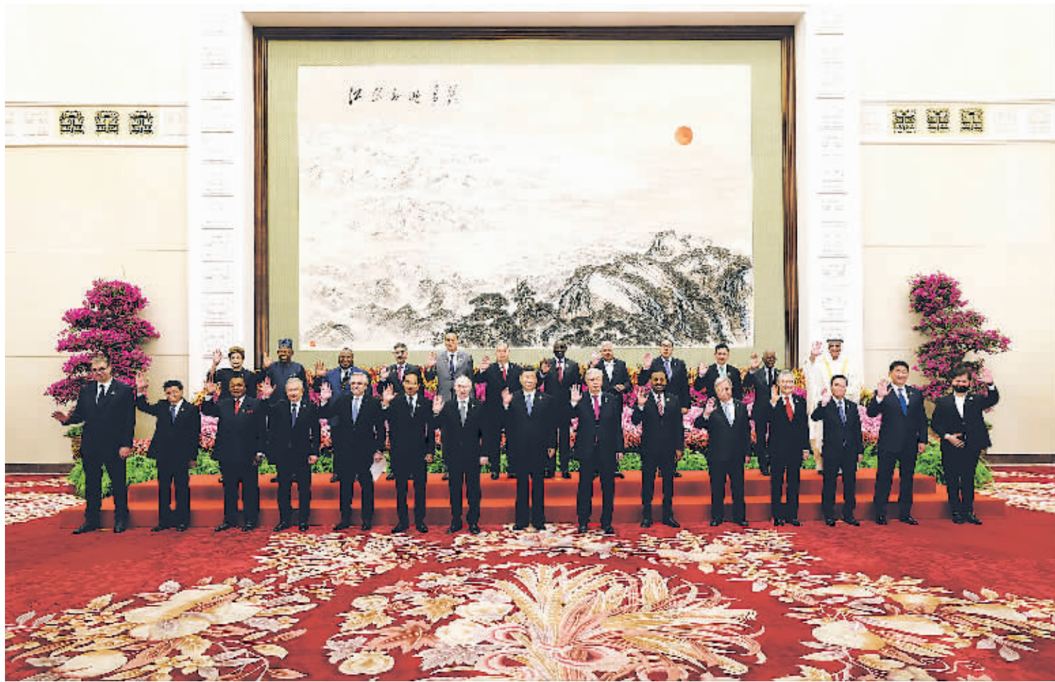
10月18日上午,国家主席习近平在北京人民大会堂出席第三届“一带一路”国际合作高峰论坛开幕式并发表题为《建设开放包容、互联互通、共同发展的世界》的主旨演讲。这是会前,习近平同出席高峰论坛的外国国家元首、政府首脑和国际组织负责人等国际贵宾集体合影。