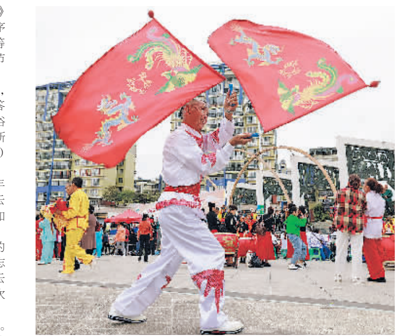
10月23日,“感党恩·庆重阳·展风采·促发展”2023年乌当区重阳节老年文体展示活动在乌当区振华广场举行。本次活动由乌当区老年人体育协会、乌当区文体广电旅游局等单位联合举办。活动现场,《太极功夫扇》表演、《多彩贵州欢迎您》柔力球展示等节目展示了老年人积极向上的精神风貌。

活动在《没有共产党就没有新中国》《唱支山歌给党听》现场大合唱中拉开序幕,紧接着,经典诵读、独唱、太极剑、相声等节目轮番登场,在座的老年人认真观看节目,现场不时响起阵阵掌声。 活动不仅开展了丰富多彩的文化活动,还设置了农村“五治”、垃圾分类知识问答环节。志愿者们向现场观众发放移风易俗等宣传手册,传递文明理念,弘扬时代新风。 (贵阳日报融媒体中心记者 李春明)