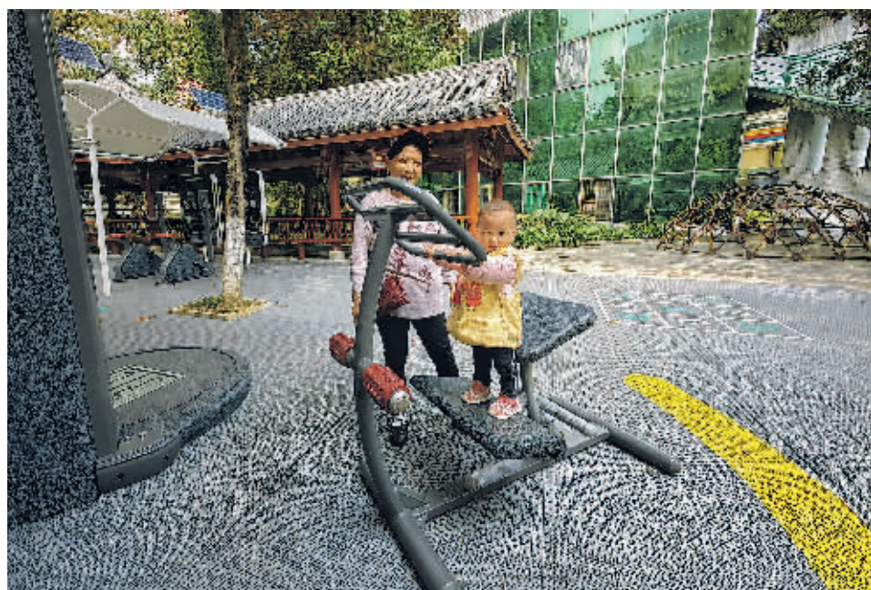
居民在碧水云天小区智能健身驿站健身。

目前,贵阳贵安高质量推进以人为核心的新型城镇化建设,加快打造宜居宜业宜游特大城市,街头巷尾正不断发生看得见、摸得着、感受得到的新变化。