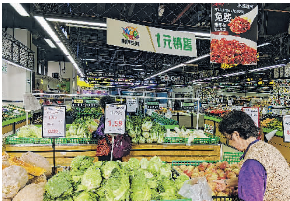
居民在改造升级后的北京路百姓生鲜超市购物。

在停车场建设上,2023年以来,贵阳贵安已建成停车位22161个,进一步缓解了“停车难”。