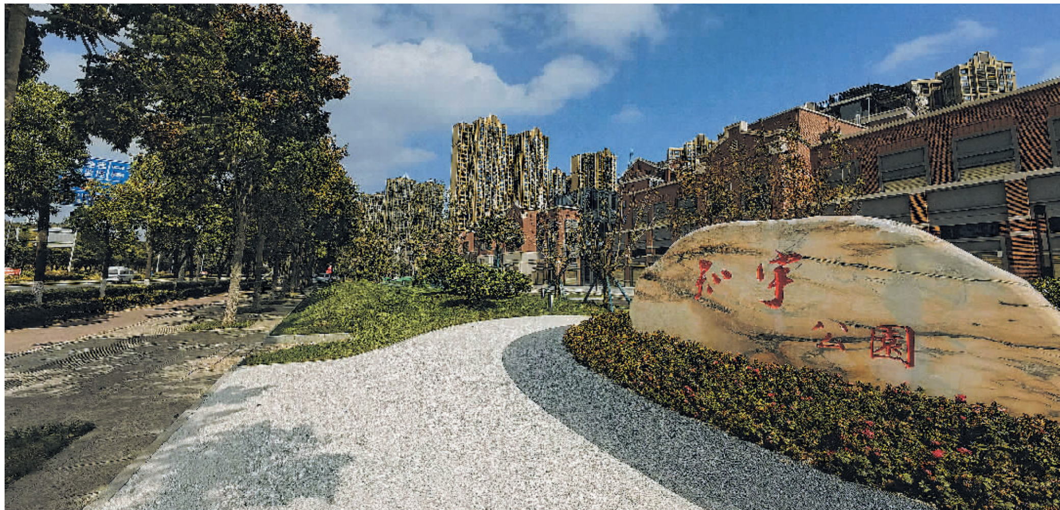
宇虹万花城小区门口的知宇“口袋公园”。

城市是人民幸福生活、安居乐业的重要载体。近年来,贵阳市委、市政府全力推进“一圈两场三改”建设,围绕“教业文卫体、老幼食住行”打造“15分钟生活圈”,建好停车场和农贸市场,加快推进棚户区、老旧小区和背街小巷改造,为市民添便利,给幸福加码。