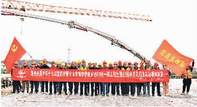
S1线一期工程土建03标项目天河潭车站封顶现场。

本报讯 12月27日,随着工人将最后一方混凝土浇筑完成,贵阳轨道交通S1线一期工程土建03标项目天河潭车站顺利完成主体结构封顶。