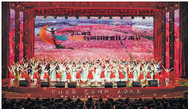
贵安新区首届校园科技文化艺术节展演活动现场。

本报讯 12月28日,以“科技引领·艺术相伴·助力成长”为主题的贵安新区首届校园科技文化艺术节举行闭幕式。