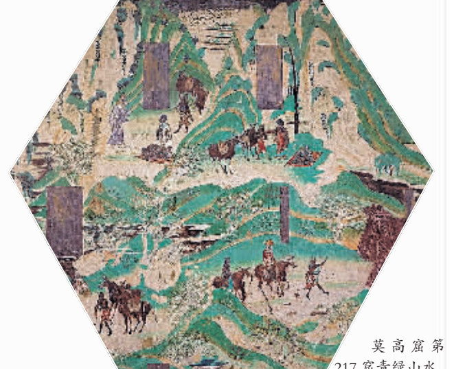
莫高窟第217窟青绿山水。