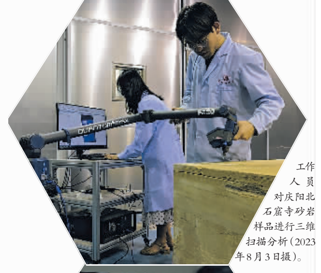
工作人员对庆阳北石窟寺砂岩样品进行三维扫描分析(2023年8月3日摄)。