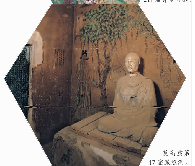
莫高窟第17窟藏经洞。