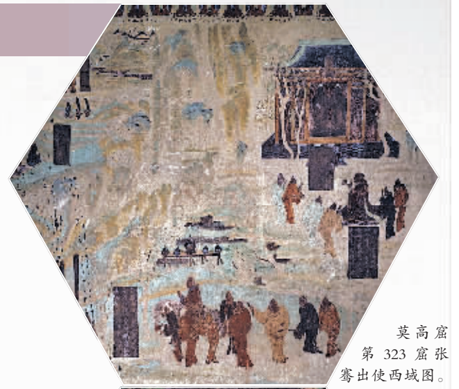
莫高窟第323窟张骞出使西域图。