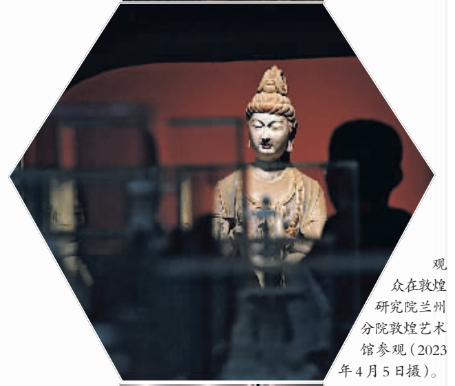
观众在敦煌研究院兰州分院敦煌艺术馆参观(2023年4月5日摄)。