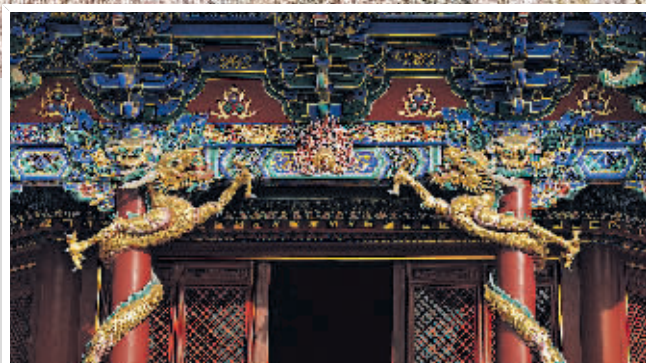
◀ 沈阳故宫建筑上的金龙盘柱。