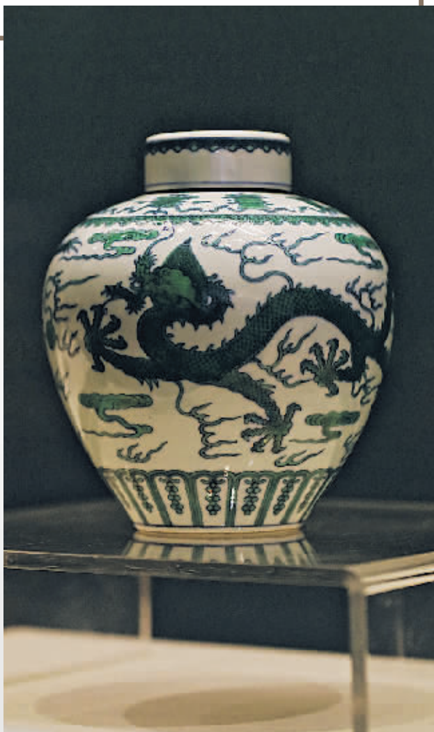
沈阳故宫博物院藏乾隆款绿釉龙云纹盖罐。