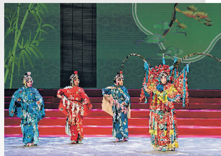
演员在舞台上表演京剧。