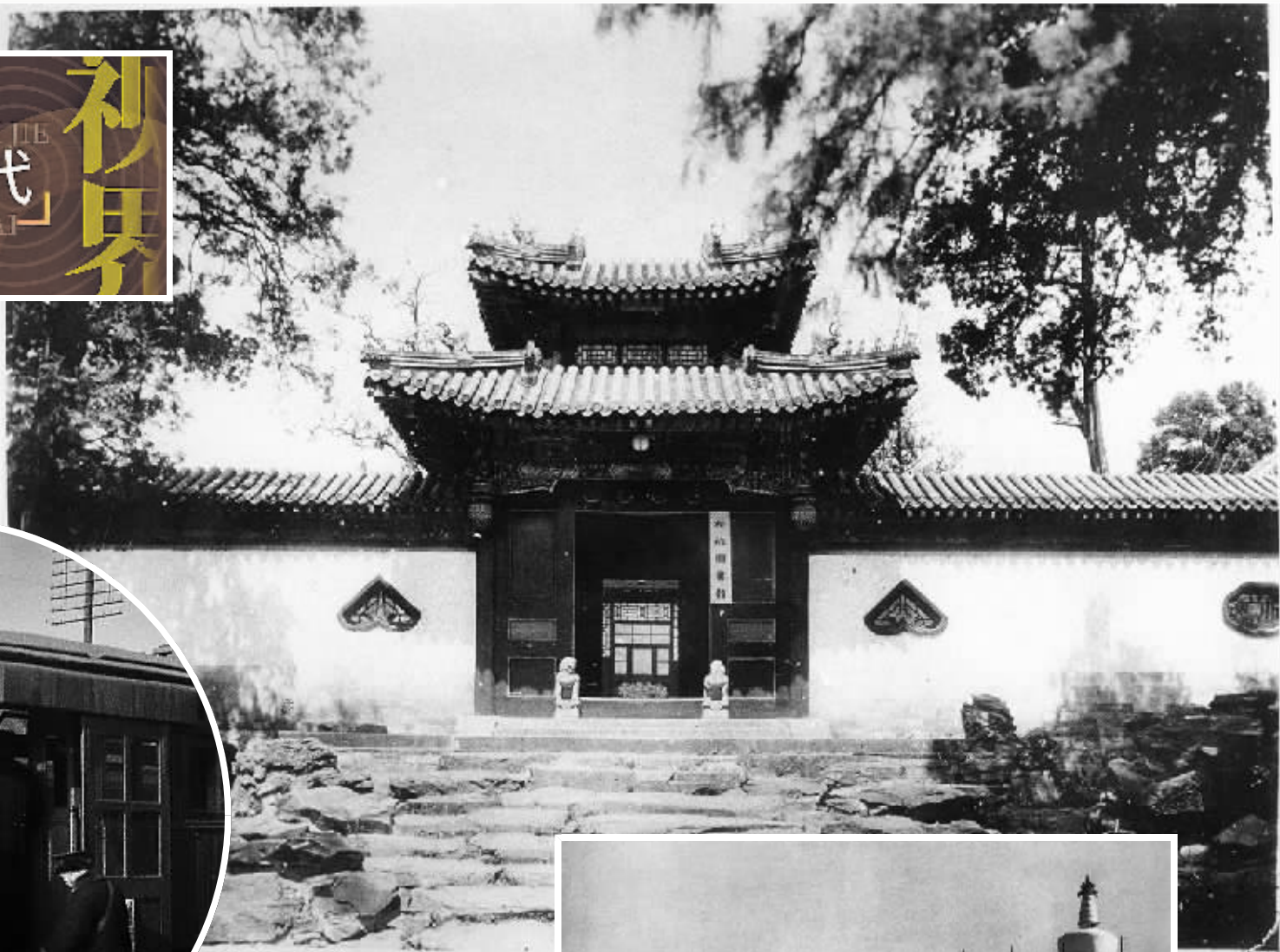
▲北海公园内的松坡图书馆,由梁启超创建,后与国团合并。