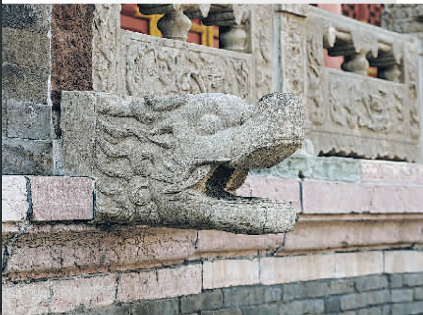
沈阳故宫建筑上的龙头排水。