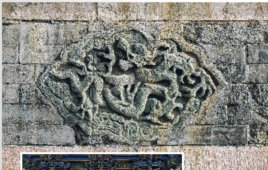
▲ 沈阳故宫建筑上的石雕团龙。