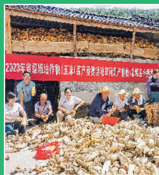
息烽县小寨坝镇大湾村玉米高产竞赛获得大丰收。