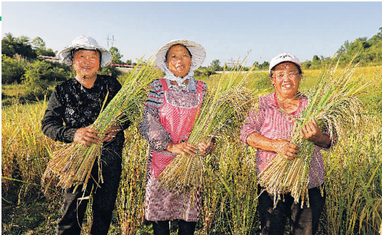
花溪区高坡乡高坡村农民手捧丰收的水稻。

过去的一年,贵阳市农业农村局全面贯彻中央、省“三农”工作决策部署,按照市委“5555443”工作思路,坚定不移“强三农”,农业农村经济形势稳中向好,农村社会事业稳步推进,乡村振兴全面推进,农业农村高质量发展基础更加夯实。