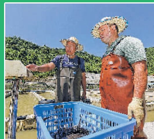
村民在息烽县西山镇小堡村生态鱼养殖基地为水产称重。