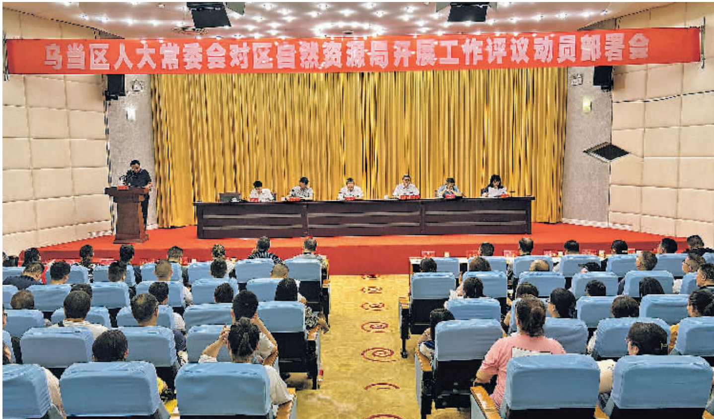
乌当区人大常委会对区自然资源局开展工作评议。

人大履职与法治具有内在一致性。过去一年,乌当区人大常委会始终牢记习近平总书记关于“更好发挥法治固根本、稳预期、利长远的保障作用”重要论述,把维护宪法法律权威作为履职重点,统筹推进“一府一委两院”依法行政、依法监察、公正司法。 加强干部监督。建立“任前法律考试,任中履职报告、向宪法宣誓,任后述职测评”的全过程干部监督链条,首次听取4个政府组成部门“一把手”报告履职情况,并进行测评,加强人大任命干部的法律知识和法治意识。 推动公正司法。加强对法官、检察官的监督,对诉讼治理、诉讼服务中心建设、未成年人检察工作情况开展专题视察,推动更多基层法治力量向引导和疏解端用力,保障未成年人合法权益,促进司法公正。做好人大