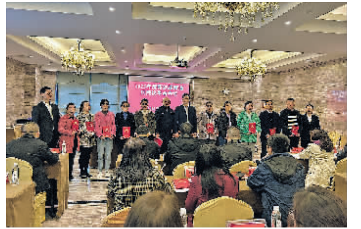
乌当区新创路街道居民议事会议。

征途回望千山远,前路放眼万木春。2023年已经落下帷幕,奔腾的2024曙光而至。新的一年,承载着人民的期待,肩负着神圣的使命,乌当区人大及其常委会将继续坚持以习近平新时代中国特色社会主义思想为指导,衷心拥护“两个确立”,忠诚践行“两个维护”,认真贯彻落实省委、市委和区委决策部署,着力在坚持党的领导、强化监督刚性、发挥代表作用、践行全过程人民民主和加强自身建设等方面下功夫,切实履行宪法和法律赋予的职责,守正创新、担当实干、凝心聚力、履职为民,为奋力谱写“美丽乌当·活力新城”现代化新篇章贡献更多人大力量。