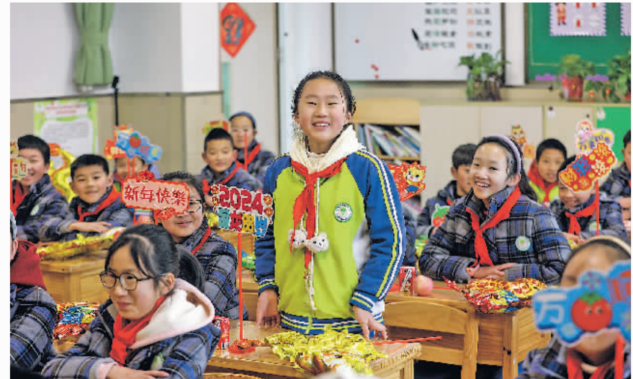
2月26日,贵州师范大学贵安新区附属小学学生在分享春节与家人游玩的喜悦。

本报讯 2月26日,贵安新区3.8万名中小小学生迎来新学期。有关部门和各学校提前准备,精心组织,确保开学安全有序,让学生们快乐上学。