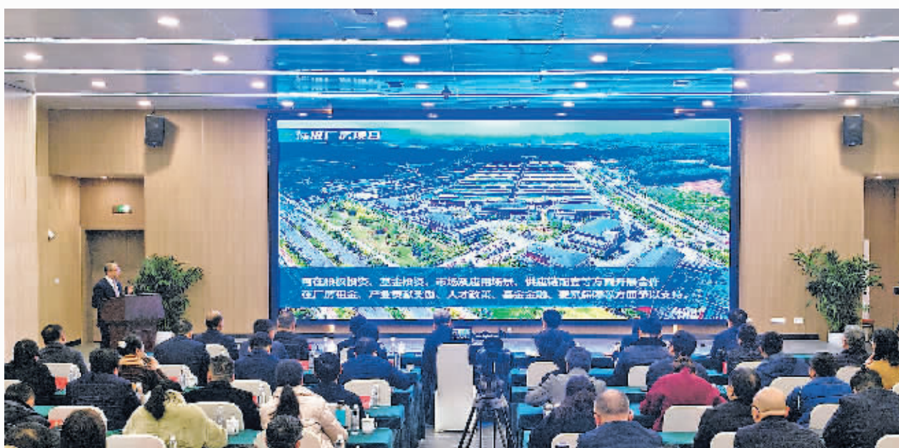
参赛选手在贵安新区2024年招商引资大比武上作项目推介。

在两个多小时的比武中,各支队伍分别围绕新区概况、要素优势、产业载体、招商重点、合作支持、企业服务等内容,展现新区的比较优势、产业定位、发展潜力,并对评委提出的问题一一认真