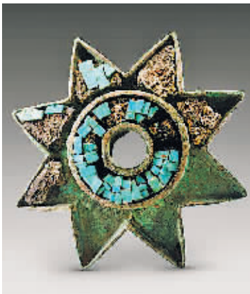
寨沟遗址后刘家塔墓地出土的铜八角形车衡饰。