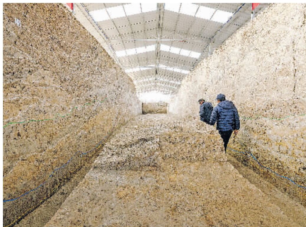
考古人员在屈家岭遗址熊家岭水坝现场进行考古工作。

该遗址建筑层级分明、秩序井然,四川大学历史文化学院学术院长霍巍表示,“这是在当地首次发现规模宏大、格局规整的大型建筑群,是国家意志的体现,具有极强的礼仪性,体现了中国古代