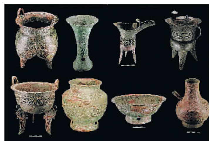
商都书院街墓地出土的青铜器。

霍州窑址位于山西省临汾市霍州白龙镇陈村。考古队揭露出宋末、金、元、明时期的窑炉、作