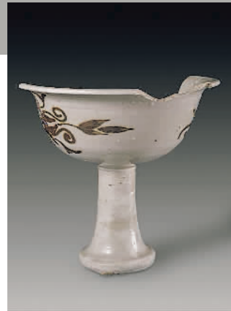
陈村窑窑址出土的明代白地褐花高足杯。