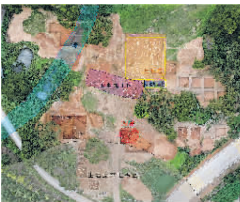
壳丘头遗址功能区分布图。

分子生物学的初步研究表明,平潭史前人群与中国南方和东南亚族群有较近的遗传关系,同样表明了南岛语族早期人群的大陆来源。植物考古研究则发现,水稻和粟在距今 4800 年至 4600 年期间传入台湾地区。陈星灿指出,壳丘头遗址群的考古发现深化了对我国东南沿海地区史前人群利用海洋资源以及史前农业文化向东南亚岛屿地区扩散历程的认识,为探索南岛语族起源与扩散提供了重要线索。