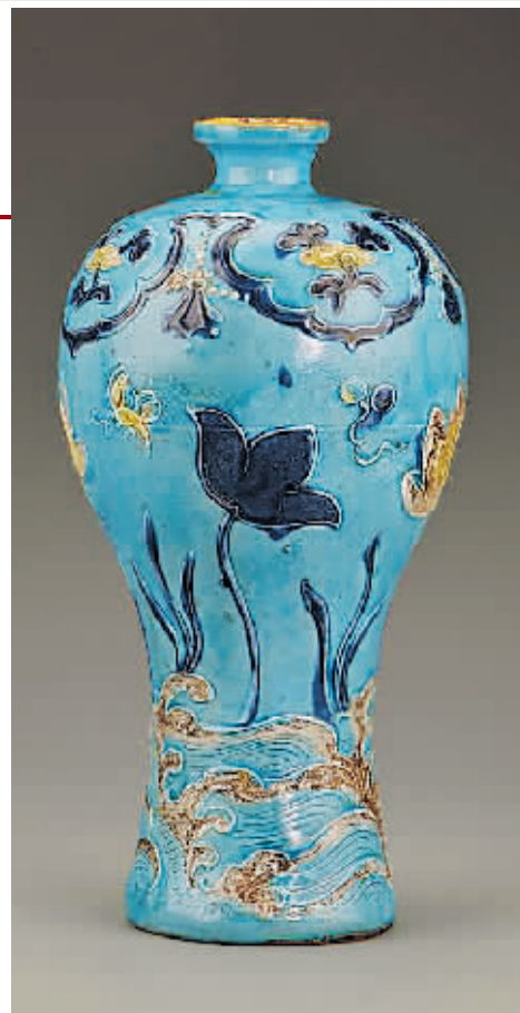
南海西北陆坡一号沉船出水的珐华彩莲纹梅瓶。

“屈家岭遗址依势而建,其规模庞大的史前水利系统是迄今发现最早且明确的水利设施之一,标志着史前先民的治水理念,从最初被动地防