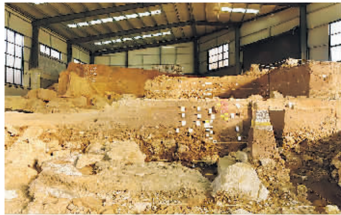
跋山遗址 8 米厚地层堆积。