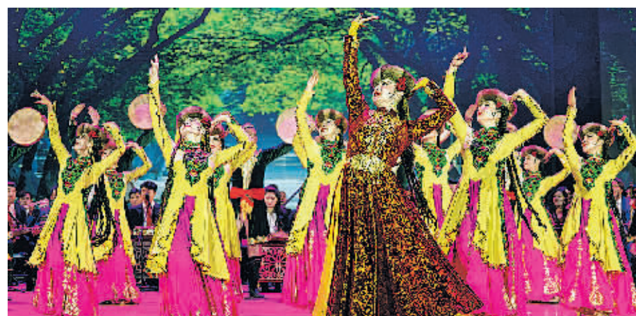
第三届新疆喀什“帕米尔之声”民族音乐节文艺晚会近日在喀什库尔塔吉克自治县上演。来自北京、乌鲁木齐、喀什等地的文艺工作者齐聚帕米尔高原，为观众带来一场多元荟萃的艺术盛宴。图为演员在表演木卡姆《我的爱献给祖国母亲》。