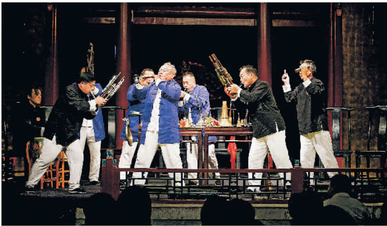
“周家班”演出剧照。