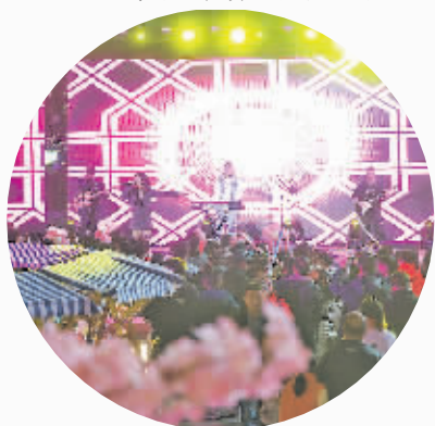
3月15日,“花满云谷只‘樱’有你”活动举行。

还开展了游园嘉年华、手作体验、樱花市集等活动,展示和推介贵州各地的旅游产品及文创美食,探索农文旅产业融合,激发“经济之花”的长久生命力。