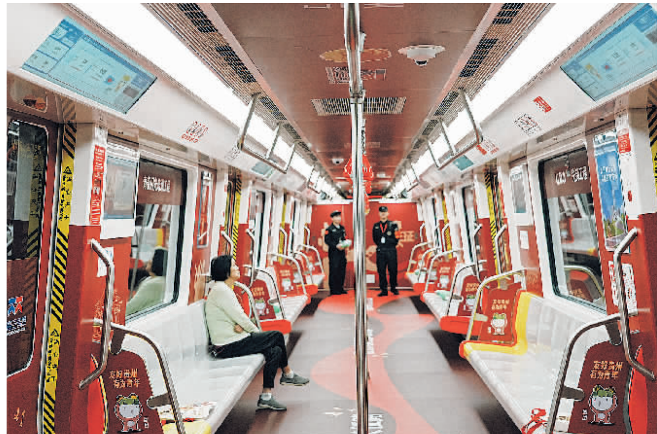
“青春遇见贵州·中铁筑梦黔行”专列车厢内部。