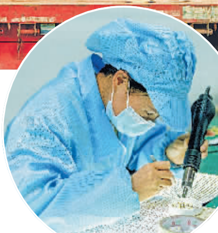
贵阳市商贸学校学生在贵州旭鼎光电科技有限公司实训。

贵州华锦已连续5年入选贵州省“百强企业”，是清镇市工业主导产业“铝及铝加工”的龙头企业，其氧化铝产能达160万吨/年，这几年均处于满产状态。在实施节能降耗技改项目后，贵州华锦的产能进一步提升。今年一季度，贵州华锦产能约42.39万吨，产值约12.48亿元，实现产销两旺。