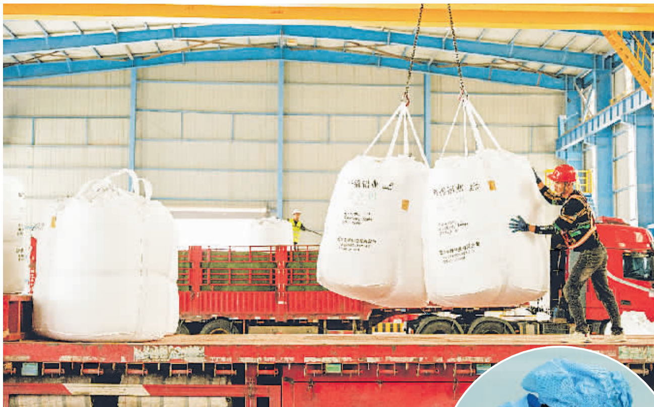
贵州华锦铝业有限公司车间内，工人将氧化铝成品装车。

由清镇企业贵州南凡半导体科技有限公司与贵阳市商贸学校合作打造，主业与南凡半导体相近，以生产半导体照明器件为主，例如LED光源、驱动电源等，是以实训为目的的生产型实体企业和产教融合企业，其厂房就在贵阳市商贸学校的实训基地内，可为学校的工业机器人技术应用、物联网技术应用等专业的学生提供实训和实习工位100余个。贵州南凡半导体科技有限公司2021年在清镇建厂后，产值稳步攀升，2023年达9000多万元，营收水平远超预期，于是接连追加投资启动后续项目建设，并打造了旭鼎光电。