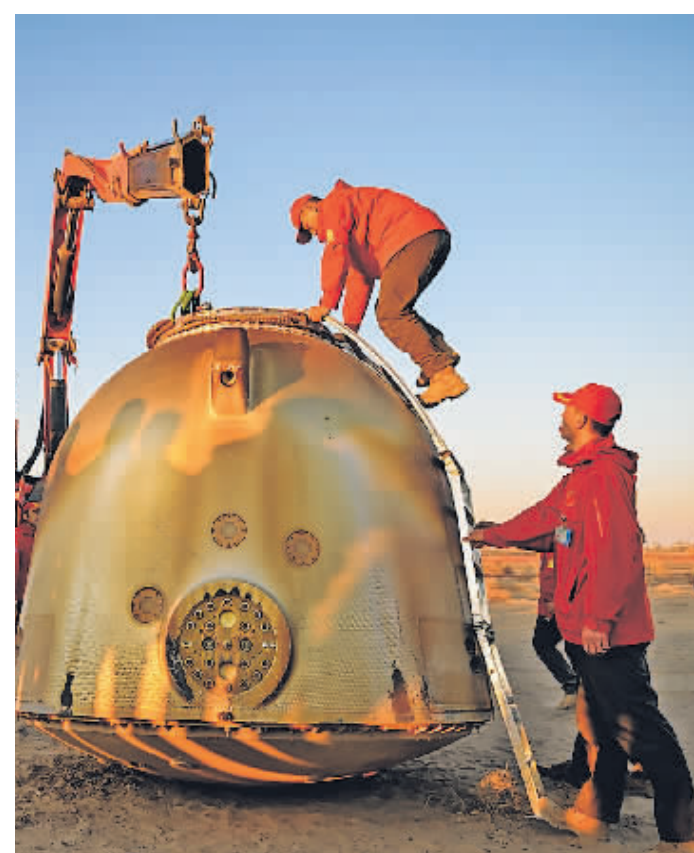
4月30日,工作人员在现场处置返回舱。

新华社酒泉4月30日电 4月30日17时46分,神舟十七号载人飞船返回舱在东风着陆场成功着陆,现场医监医保人员确认航天员汤洪波、唐胜杰、江新林身体状况良好,神舟十七号载人飞行任务取得圆满成功。