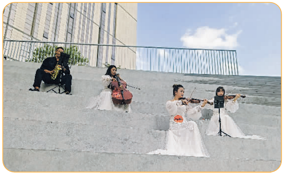
全“橙”热爱——“橙”市轻音乐会在莫奈花园举行。