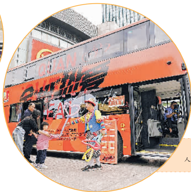
全“橙”热爱主题巴士上的演艺人员向乘客赠送气球。