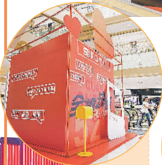
国贸金阳tpmall内的全“橙”心动奔赴热爱打卡点。