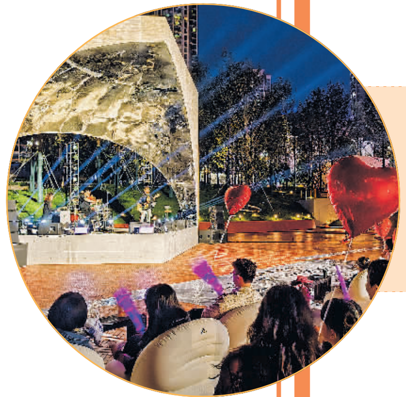
全“橙”热爱红砖剧场音乐会现场。