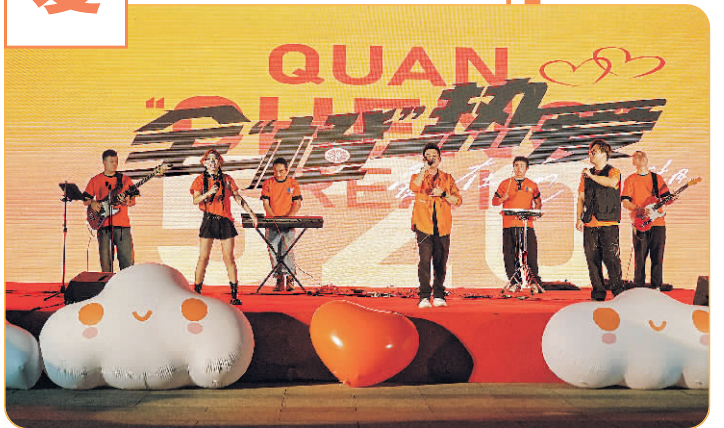
在全“橙”热爱国贸CC PARK B馆外广场音乐会上,乐手激情演唱。