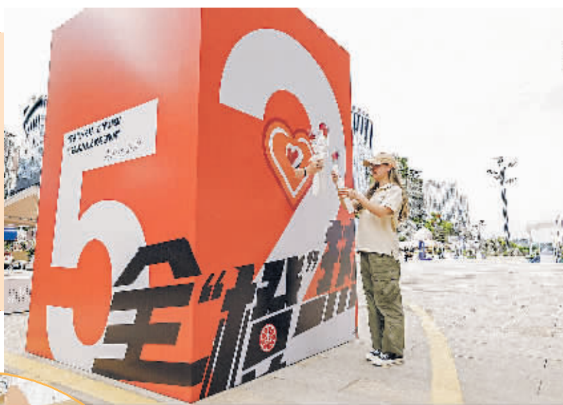
民赠送玫瑰花。 荔星中心的工作人员向市