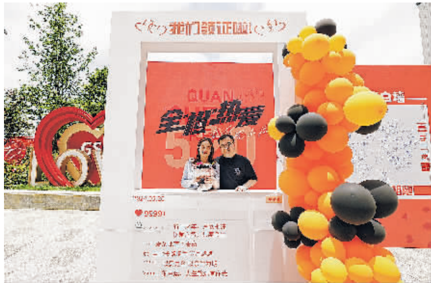
观山湖区民政局设置的“橙”心表白墙。