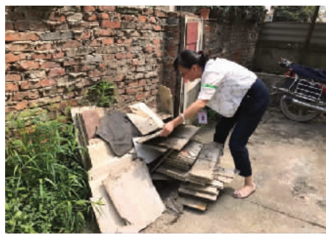
图为金欣社区机关党员清理小区废弃物。