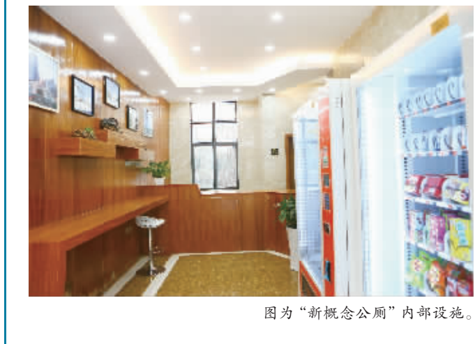
图为“新概念公厕”内部设施。