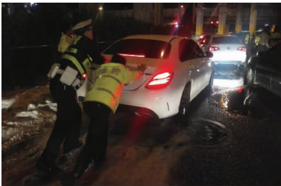
交警在帮助车辆驶离冰雹堆积路段。