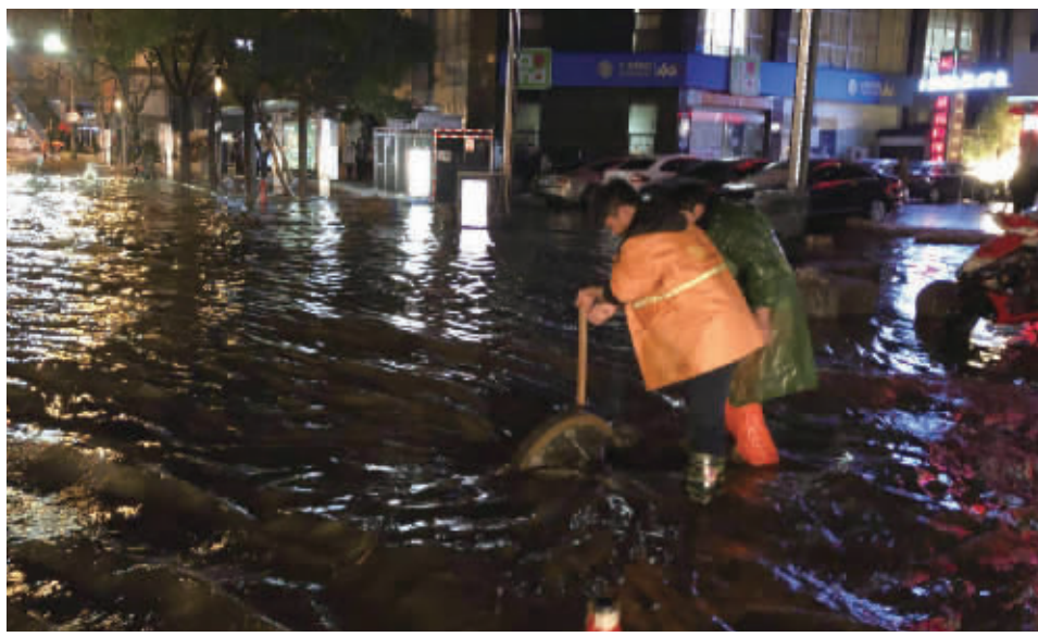
市城管局开展积水抢排工作。