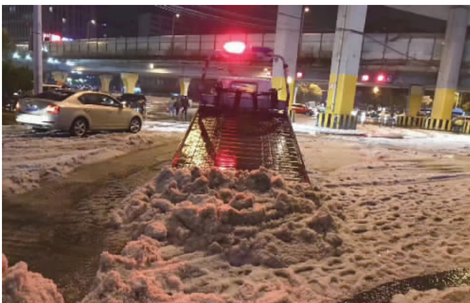
有关部门清理路上冰雹。

各防汛小组人员处置,道路开始恢复正常通行。市政部门共出动巡查处置人员360人次、车辆66台。为快速恢复路面干净和道路畅通,环卫中心班子成员分别带队,组织人员巡查高、比例例生活垃圾场安全生产工作情况及大雨对垃圾场的影响情况,对云岩区、南明区、观山湖区等的道路环境卫生情况进行巡查,并督促责任单位做好雨后的清扫保洁工作。共组织环卫应急队伍2000余人、大型环卫机械设备60余台进行落叶、树枝、冰雹等的清扫清运工作。(本报记者 汤利)