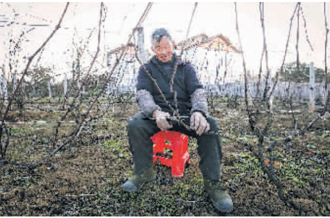
果农在为葡萄藤修剪枝。

近年来,在贵安新区推进文旅融合发展的背景下,高峰镇通过举办葡萄节、电商推广等多种销售模式,把“好葡萄”变