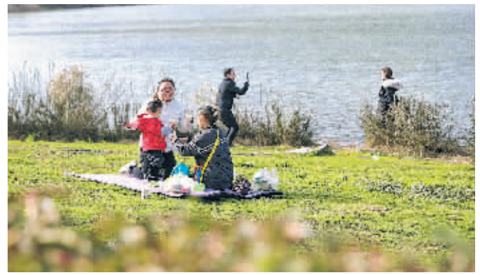
1月12日,天气晴好,气温回升,在贵安新区月亮湖公园,不少游客前来游玩,享受久违的冬日暖阳。