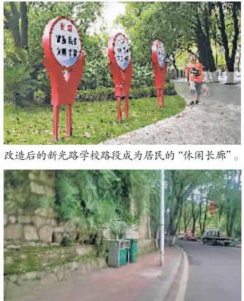
改造后的新光路学校路段成为居民的“休闲长廊”。