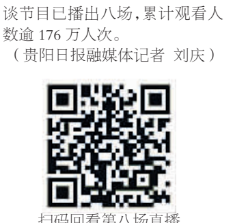
扫码回看第八场直播