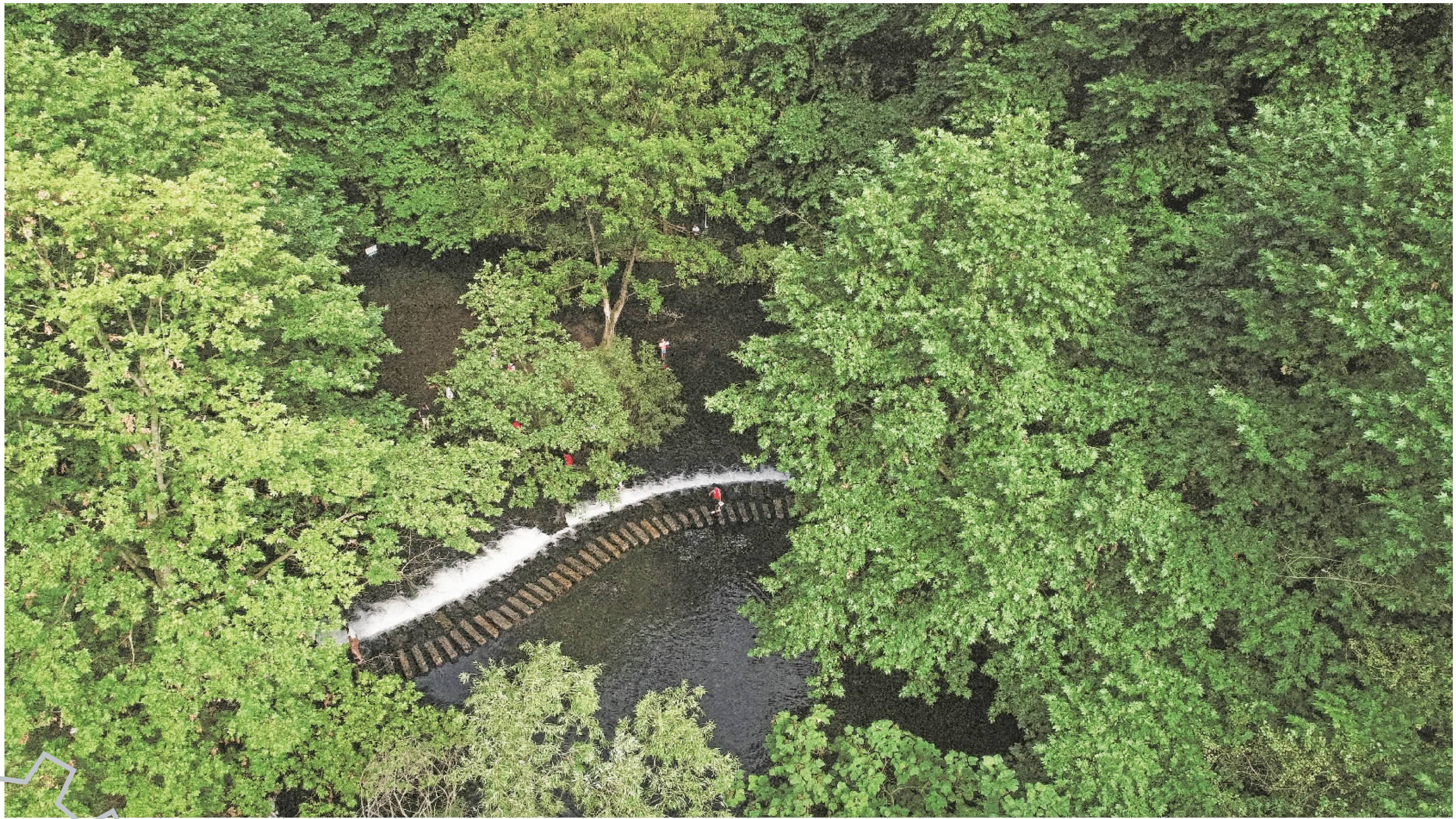
游客在树木葱茏、流水潺潺的阿哈湖国家湿地公园游玩。

今后五年,是贵阳贵安走好新时代“强省会”赶考之路的重要阶段。贵阳贵安将多层次打造“爽爽贵阳”城市IP品牌宣传矩阵,不断丰富“爽爽贵阳”的品牌内涵,真正擦亮“强省会”的靓丽名片。