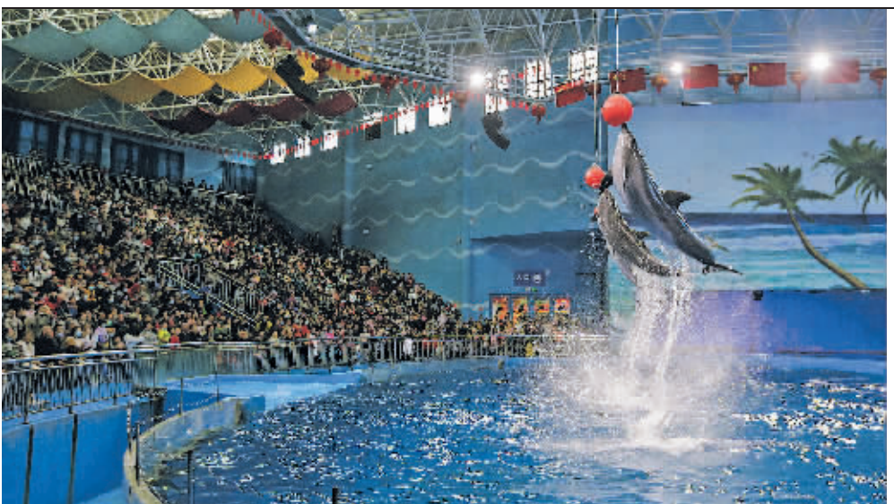
游客在贵州龙川极地海洋世界观看表演。

未来五年,贵阳还将在生活服务业方面持续发力,大力发展商贸服务业,促进“吃住行游购娱”全面提升档级,加快培育发展和有序改造一批重点商圈、特色街区、商业步行街、夜间经济示范区,建设区域性消费中心城市。