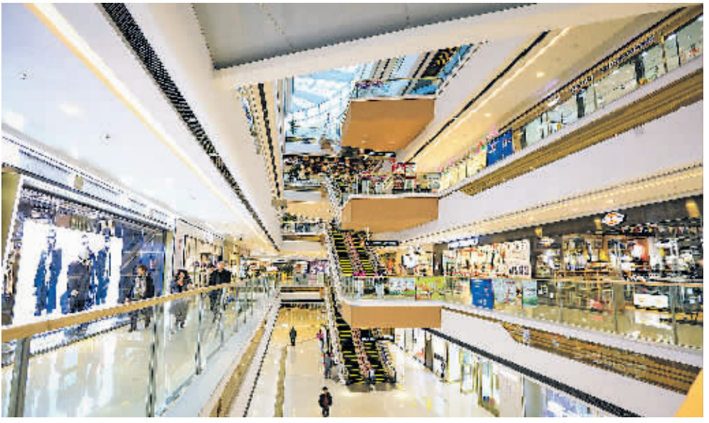
市民在位于观山湖区的万达广场购物。

在深入挖掘美食文化资源、不断加强美食文化传播的同时,贵阳正持续推动餐饮服务食品安全治理体系和治理能力现代化,在涉旅大中型餐饮企业中大力推行“互联网+明厨亮灶”,对外打造贵阳餐饮企业“明厨净几、明厨亮灶”的窗口形象,既全力打造“舌尖上的美味”,更全力保障“舌尖上的安全”。