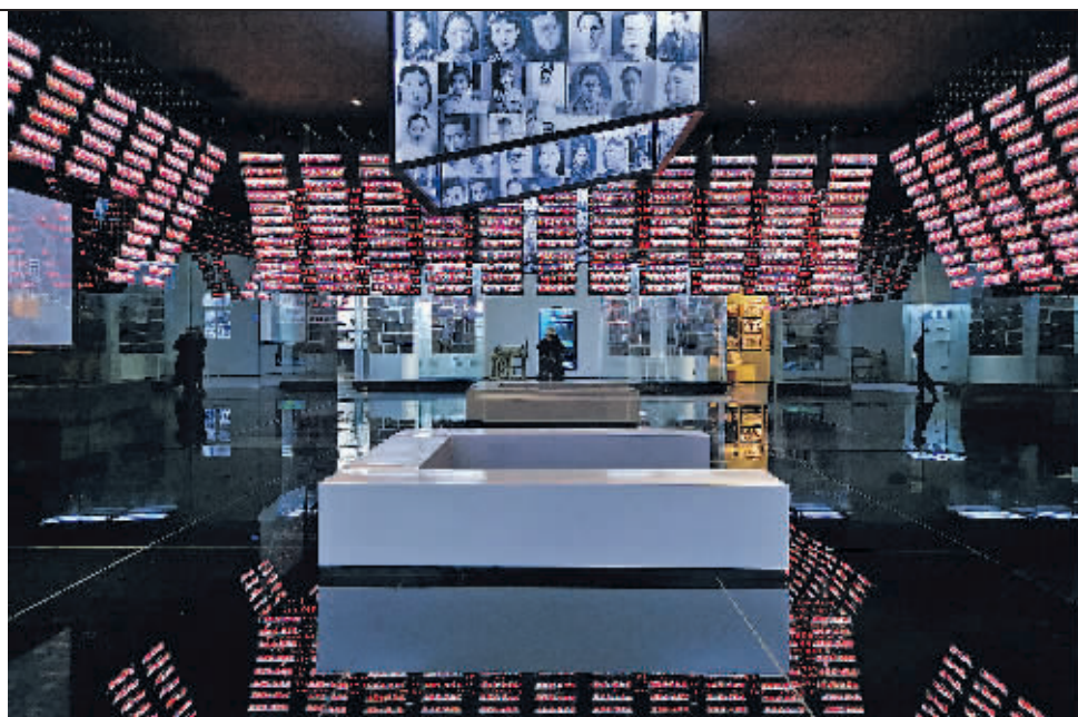
市民在中国红十字会救护总队贵阳图云英航纪念馆内参观。

近年来,在发挥纬度、高度、温度、湿度、浓度、风度“六度”优势的基础上,贵阳紧盯系统治理,深入实施蓝天、碧水、净土、固废治理和乡村环境整治“五大攻坚战”,全面推行河湖长制、林长制,一幅宜居宜业宜人的新画卷徐徐展开。