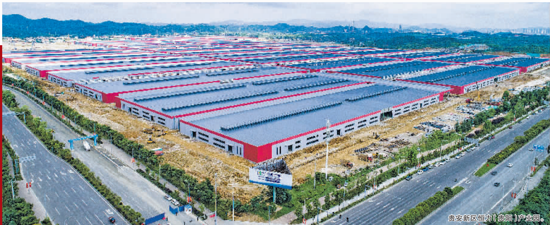
贵安新区恒力(贵阳)产业园。

主动向前，是贵安新区打造好“贵人服务”名片的坚定决心。2022年，围绕“四主四市”，聚焦“强省会”行动，贵安新区将用实实在在的工作成果为好项目、大项目纷呈沓来保驾护航。