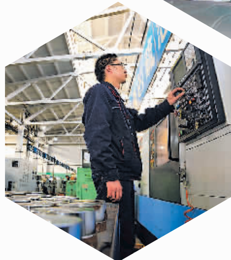
贵阳经开区的贵州枫阳液压有限责任公司加工车间内，一名技术人员在操作生产设备。