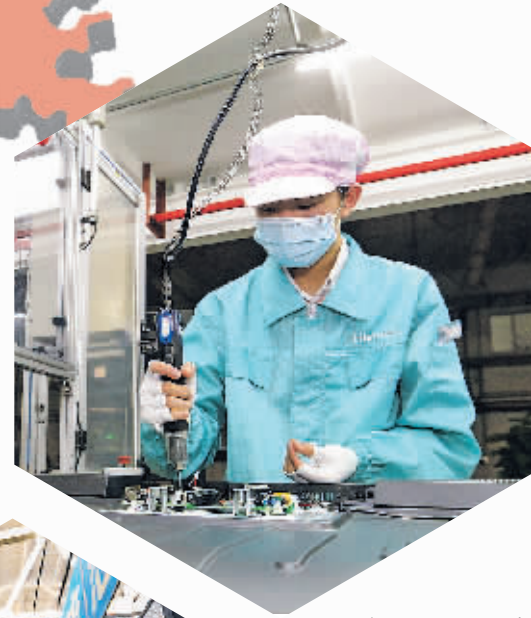
贵阳海信电子有限公司生产线。

持续推进现代服务业与实体经济融合发展，着力提高生产性服务业占三产中的比重，提升高新技术产业在规模以上工业中的比重，大力发展新兴产业和高新技术企业，引领产业链向中高端迈进，力争规模以上工业增加值（不含烟厂）同比增长20%以上，奋力实现“十四五”末“非烟部分工业增加值翻两番”的目标。