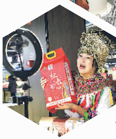
2022观山湖区同心年货节产品直播推荐。