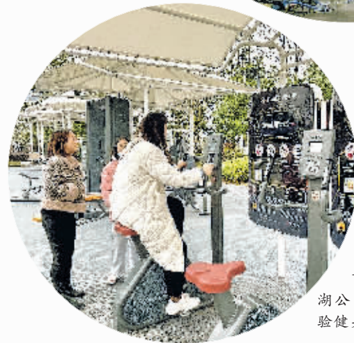
市民在位于白云区泉湖公园的智能健身驿站体验健身设施。

抓好城市治理。全面开展城市“五治”攻坚战，推进“六个乱象”治理工作，持续巩固创文成果；继续开展“铁腕治堵”，重点解决同心路至白云南路、七机路口、中坝路口等地的交通堵塞问题；制定城区风貌、工地围挡、道路景观等城市管理标准，实现城市管理标准统一；推进“智慧白云”建设，持续完善网格化管理。