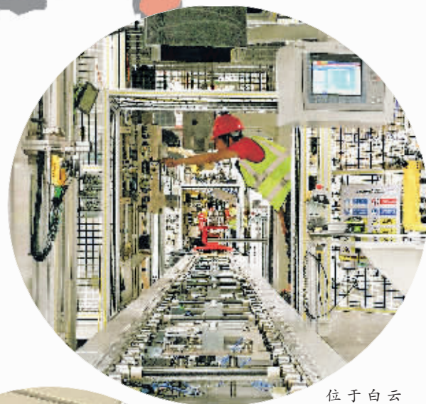
位于白云区的贵州吉利发动机有限公司发动机生产线装配车间。

围绕旅游产业化，加强温泉度假、康养医养、乡村民宿、旅游装备制造、旅游商品研发等项目招引和落地，力争全年新增旅游市场主体150家；促进“旅游+”“+旅游”多产业融合发展，推出白云区“云尚生活休闲四季游”品牌旅游活动，全力打造2条精品旅游线路，确保全年接待游客和旅游总收入分别完成740万人次、85亿元；持续实施旅游标准化示范引导工程，搭建智慧旅游服务平台，提升服务质量。