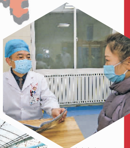
患者在花溪区人民医院“夜间专家门诊”就诊。