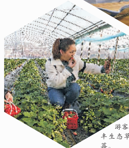
游客在位于花溪区石板镇的黔丰生态草莓采摘观光园内采摘草莓。