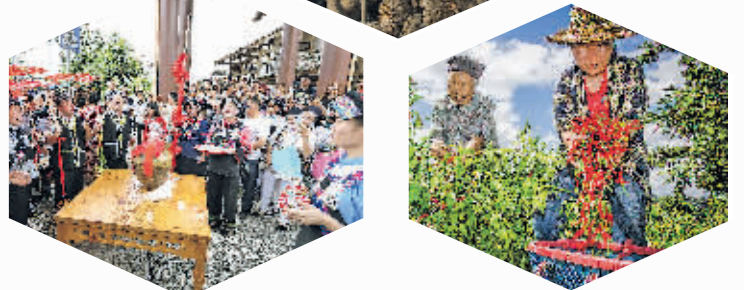
花溪区青岩镇龙井村布依族村民摆“拦门酒”迎接游客。