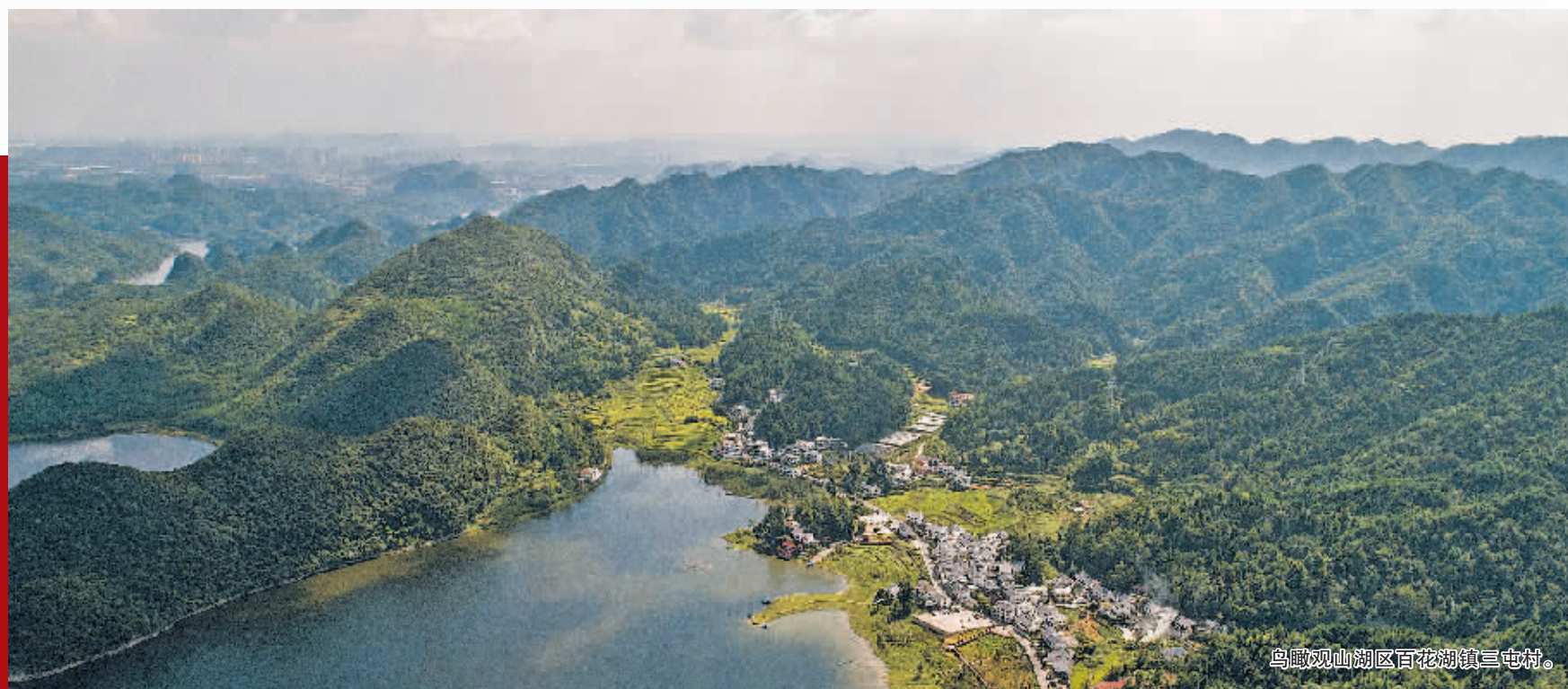
鸟瞰观山湖百花湖镇三屯村。

全力为强民生作贡献，持续推进农村“五治”，围绕“教业文卫体”做好民族教育、体育、医疗工作和“老幼食住行”公共服务体系，让民族乡村群众的生产生活更有保障；进一步强化基层治理，发挥“四员”队伍作用，认真做好平安贵阳建设，创造和谐稳定的社会环境。