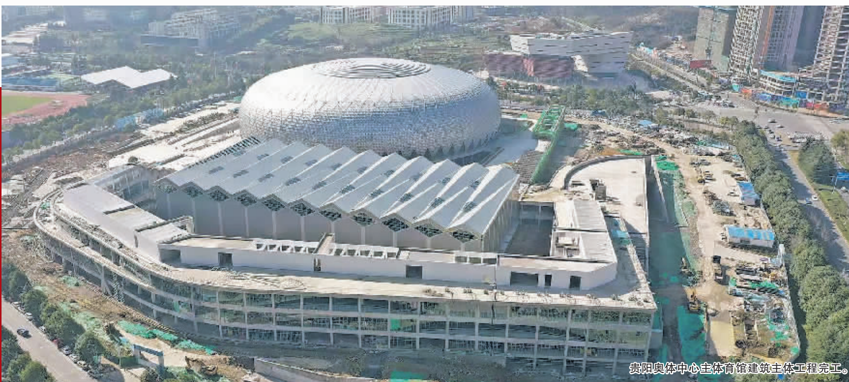
贵阳奥体中心主体育馆建筑主体工程完工。

在推进“体旅融合”中，积极开发跑步骑行、徒步越野、汽摩露营等具有消费引领特征的运动项目和特色赛事活动，创建一批省级、市级体育旅游示范基地、体育旅游精品线路、体育旅游目的地等。以“大数据+体育”为抓手，协同推进智慧体育发展。