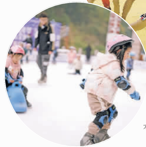
小朋友在云岩区万达广场滑冰场玩耍。