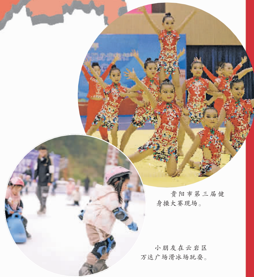
贵阳市第三届健身操大赛现场。