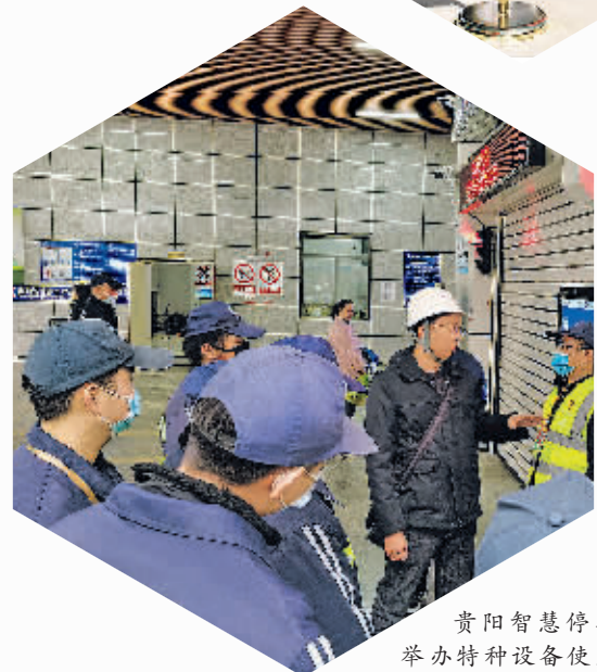
贵阳智慧停车公司举办特种设备使用管理日常培训。