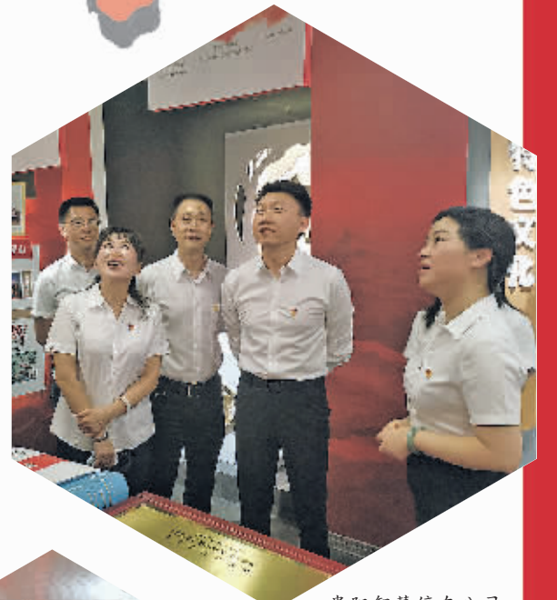
贵阳智慧停车公司与工商银行贵阳支行开展党建共建活动。