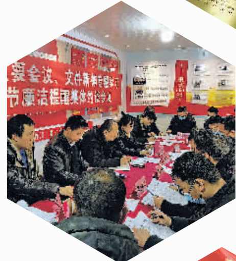
贵阳智慧停车公司开展廉洁提醒集体约谈,进一步筑牢拒腐防变思想底线。