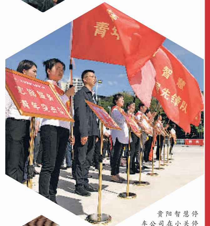
贵阳智慧停车公司在小关停车场项目承办市交通集团“党员先锋队”“青年突击队”授旗仪式。