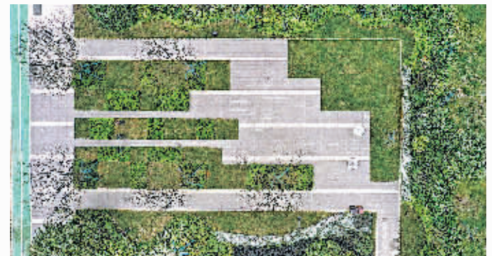
人才公寓小区绿化。

万科翡翠天骄人才公寓拥有1000多平方米的绿地,供业主在工作、生活之余漫步。同时,小区内各种足球、乒乓球等体育锻炼场地,为人才体育锻炼提供便利。