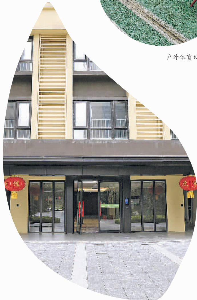
人才公寓入户单元。