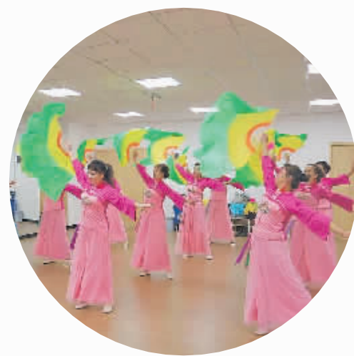
国际城光和邻里活动中心参加文艺活动的业主们的日常排练。