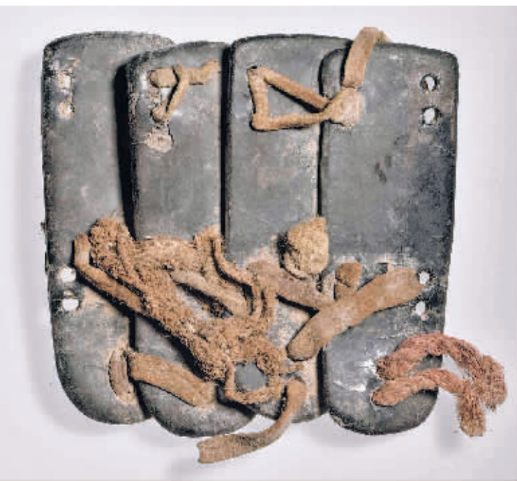
遗址出土的铠甲残片。