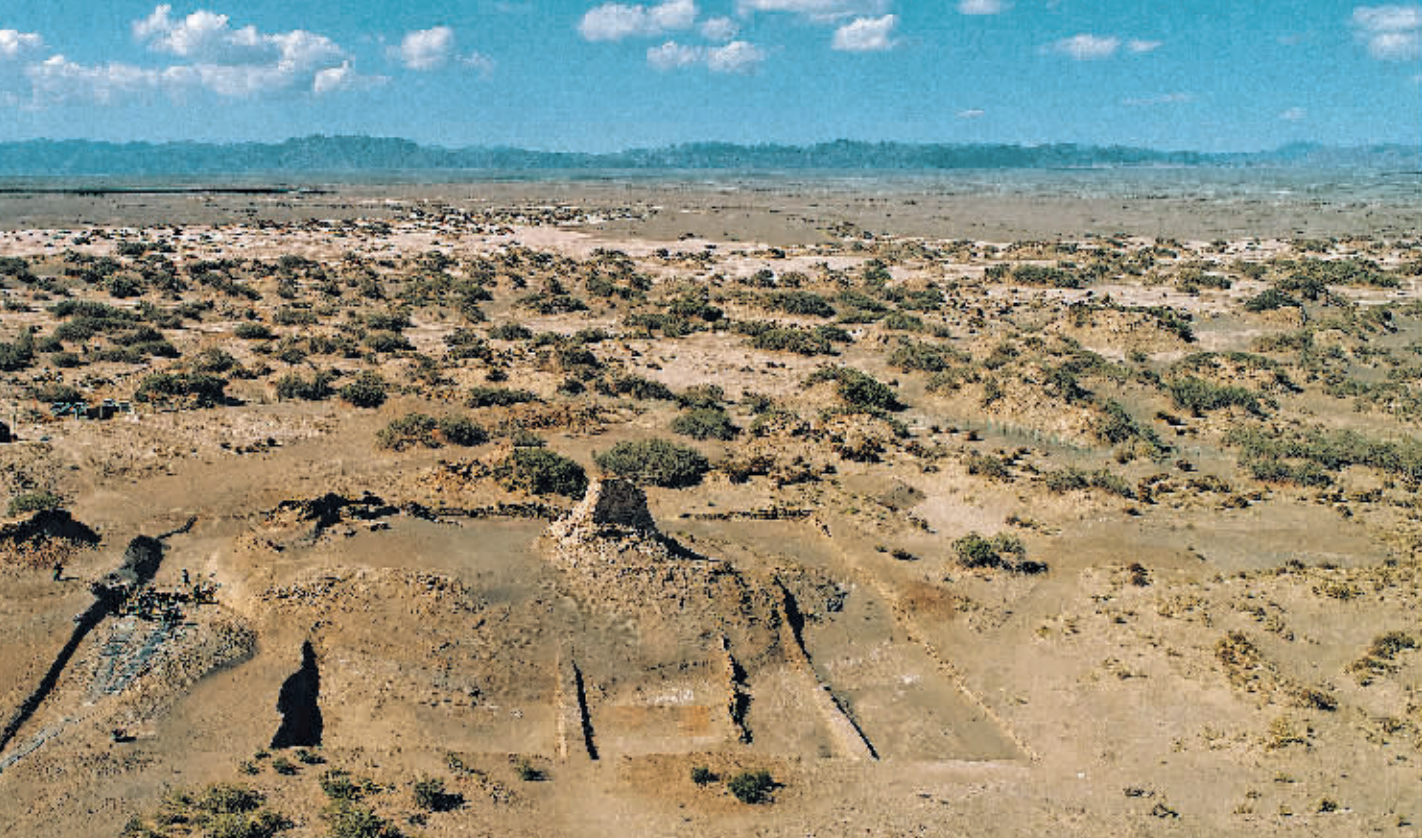
俯瞰克亚克库都克烽燧遗址全貌。