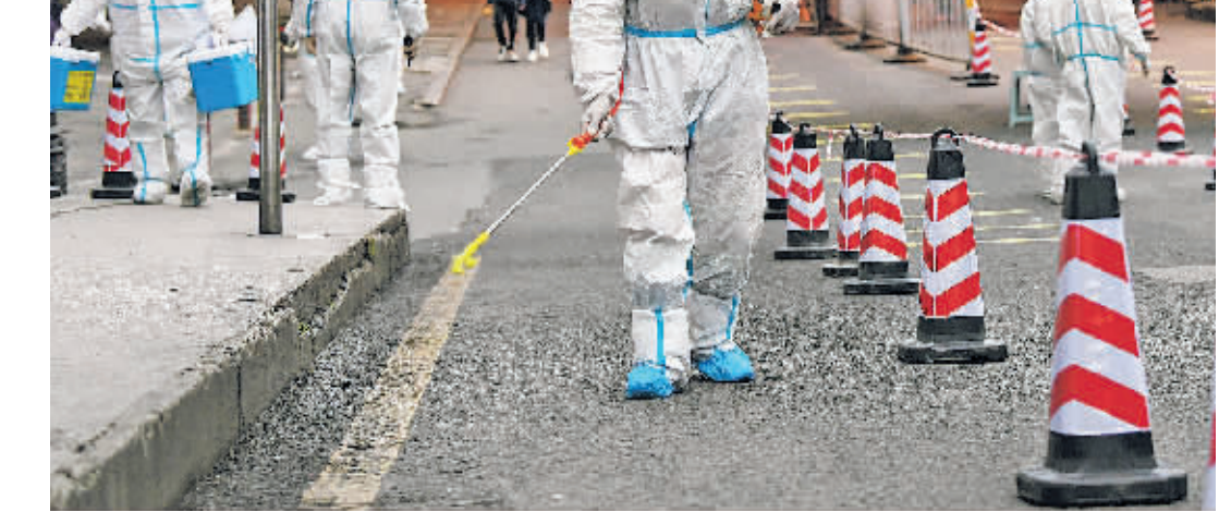
在玉溪路片区、陈庄坝片区区域核酸检测点,消杀人员在进行环境消杀。