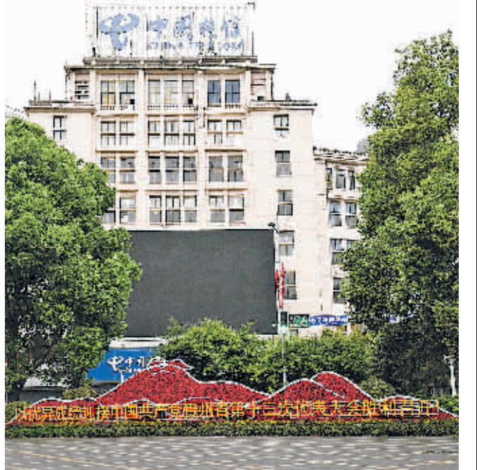
连日来,南明区综合行政执法局在遵义路、油小线、大南门转盘等主干道及重要节点路段摆放10万株时令花卉,美化城市环境,喜迎省第十三次党代会的召开。图为邮电大楼前设置的迎接省第十三次党代会胜利召开的宣传标语格外引人注目。