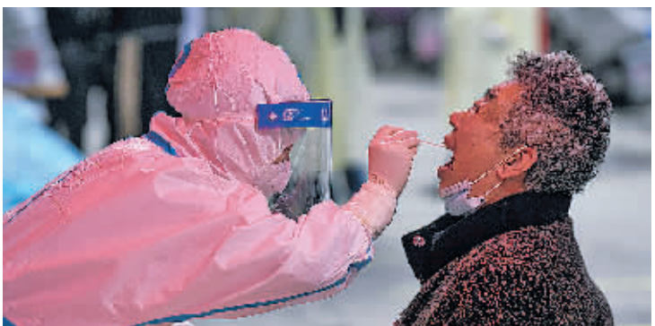
医护人员为群众进行咽拭子采样。

下一步,南明区将坚持以整洁、优美、文明、和谐的城市人居环境为优化理念,进一步丰富青云路步行街业态内容,打造集高体验、优服务、靓环境于一体的宜居、宜商、宜游的特色街区。 （通讯员 石湘）