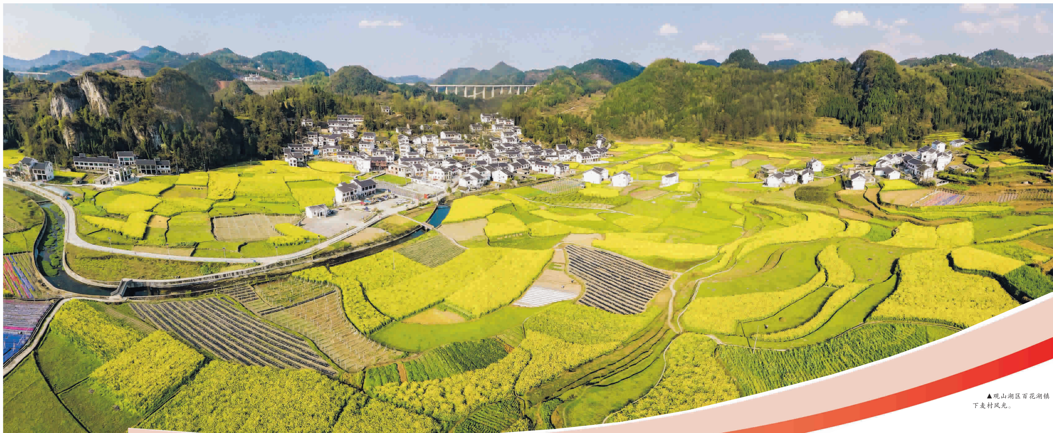
▲观山湖区百花湖镇下支村风光。

2022年,贵阳贵安以农村“五治”为抓手,全面改善农村人居环境,建设宜居宜业美丽乡村。全市上下一盘棋,握指成拳一条心,各级各部门多措并举推进各项整治工作,全面完成了2022年农村“五治”任务。农村环境明显改善,村容村貌整体提升,乡风文明蔚然成风。线上线下满意度问卷调查显示,贵阳贵安群众对农村“五治”工作的综合满意度达99.29%，“五治”工作深受群众拥护和好评。