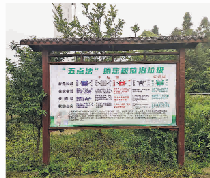
▲修文县六屯镇“治垃圾”宣传柱。