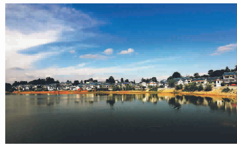
▲美丽乡村——清镇市红枫湖镇芦荻哨村。