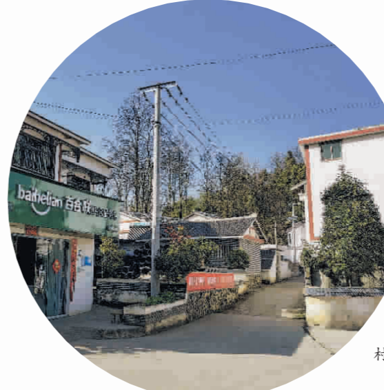
▲清镇市王庄乡小坡村干净整洁的人居环境。

调研下沉。 区(市、县)党政“一把手”和市级各牵头部门主要领导按照“沉下去、住下来、盯着干、办示范”的要求,选择1个村,开展“解剖麻雀”式蹲点调研,领街建设“五治”示范点25个。 工作下沉。 通过入户走访、坝坝会等形式,讲明政策,宣传引导,激发农民内生动力;采取“四不两直”方式,深入乡村开展暗访督导570余次,下发工作提示、通知及通报150余个,推进工作落实。 技术下沉。 聘请专家团队,组建培训技术服务队伍3487人,下沉一线开展全流程指导;编印下发技术指南、工作手册等,为基层提供技术指引,保障项目质量。