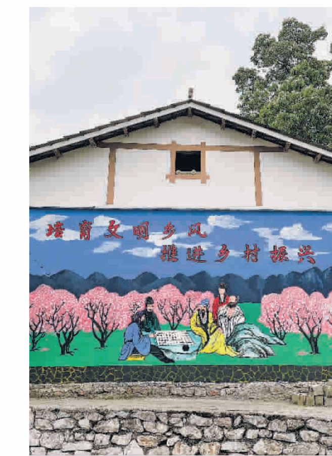
▲修文县大石乡高丰村塔石组“治风”宣传画。