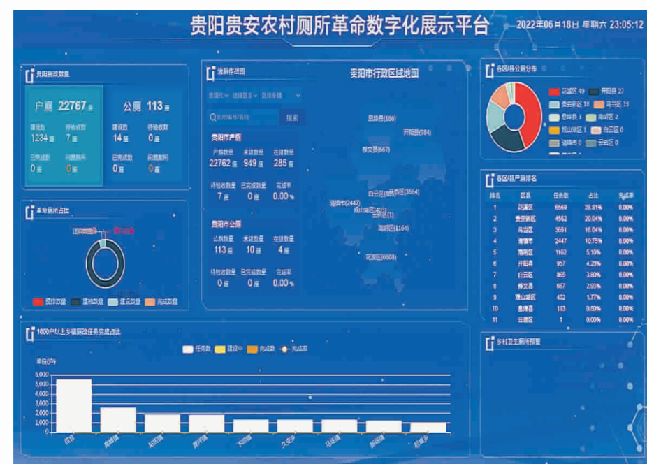
▲贵阳贵安农村厕所革命数字化展示平台。