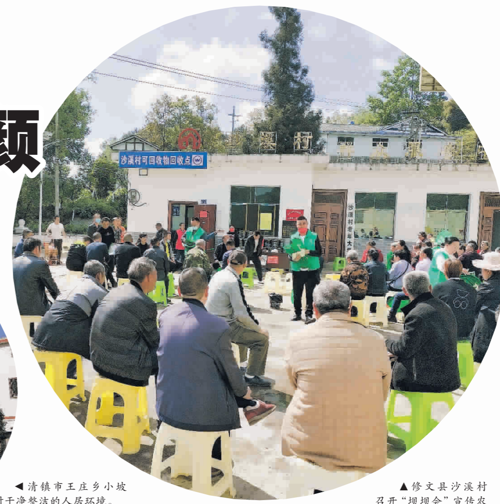
▲修文县沙溪村召开“坝坝会”宣传农村“治垃圾”。