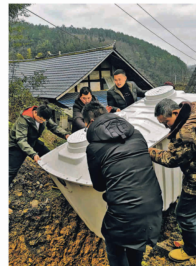
▲开阳县楠木渡镇黄木村村民在安装化粪池。