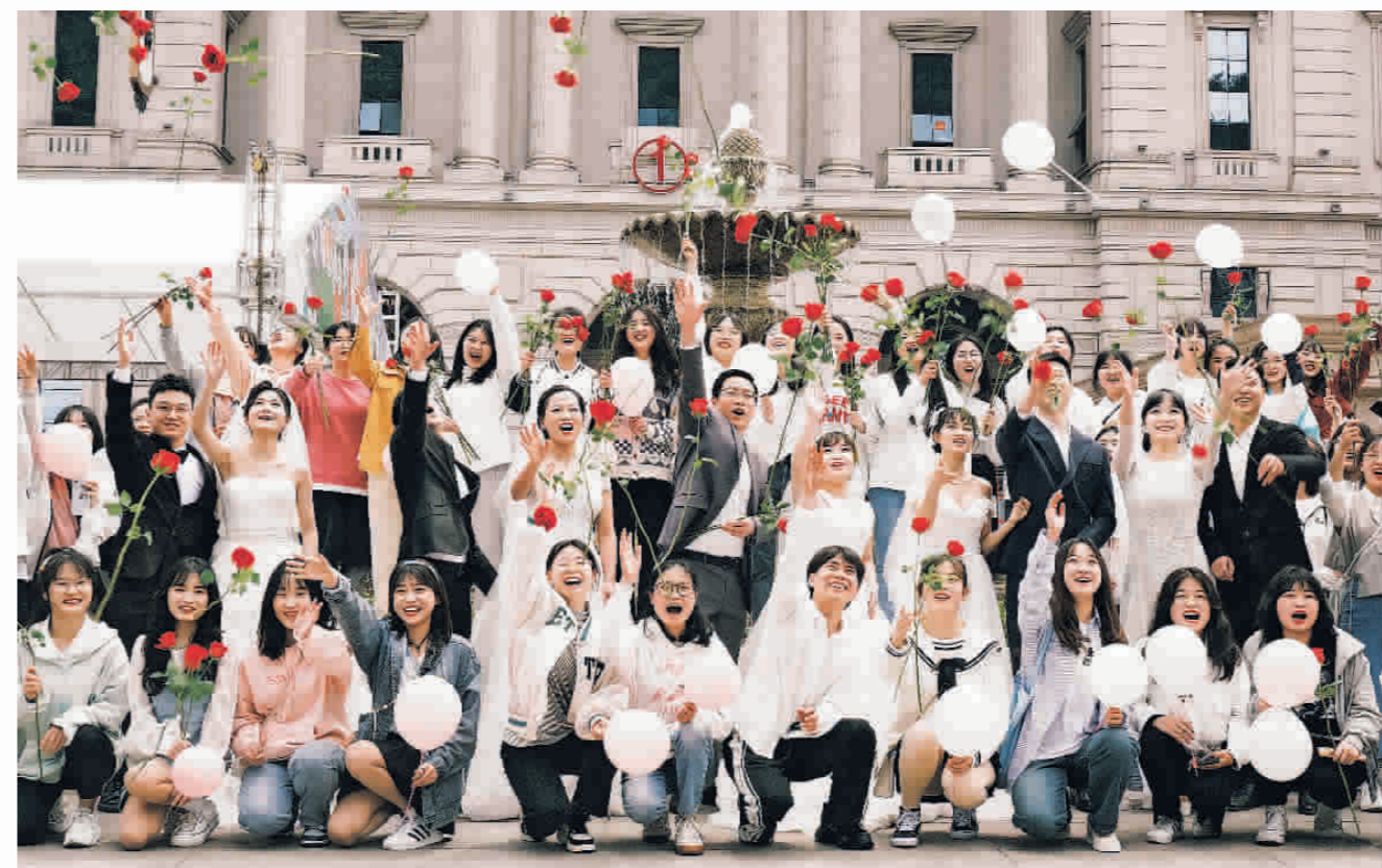
▲云岩区“新民俗·新风尚”集体婚礼现场。