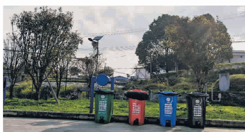
▲南明区永乐乡干井村设置的农村垃圾分类收集桶。

问需于民。 将调查摸底得到的群众意见,结合短板弱项问题,项目化纳入“十件实事”内容,高质量完成,及时回应群众需求。 问计于民。 在贵阳市融媒体中心等平台,开通“我来谈谈农村‘五治’”专题征集入口,引导群众积极建言献策。通过