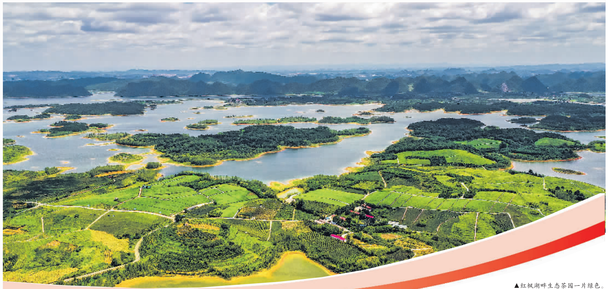
▲红枫湖畔生态茶园一片绿色。