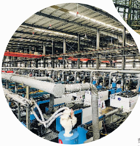
▲联盟科技发展(贵阳)有限公司的全自动配件生产车间。

坚持生态优先。坚持生态优先、绿色发展,重点抓住增绿、节能、降碳、环保“四个关键”,执行好环境准入负面清单,严控“两高”项目盲目发展,加快发展方式绿色转型,大力发展资源节约型和环境友好型产业,推动产业生态化和生态产业化,让清镇青山常在、绿水长流、空气常新,努力将清镇打造成为生态文明建设的样板区。