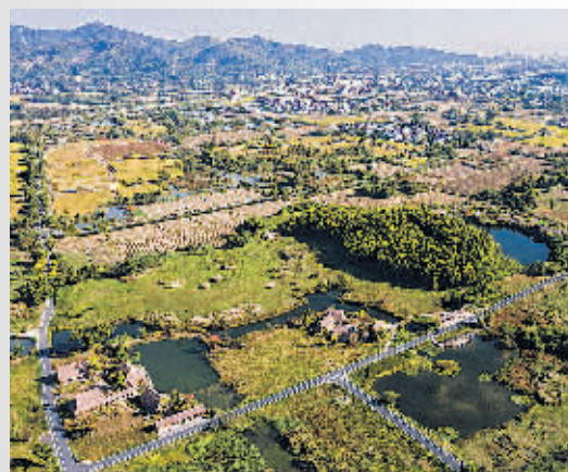
俯瞰良渚古城遗址公园。