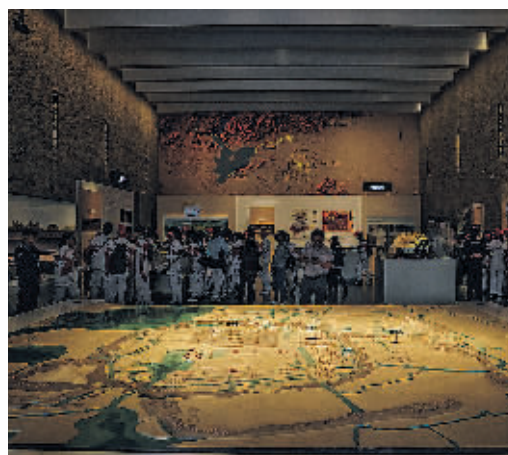
游客在良渚博物院内参观。