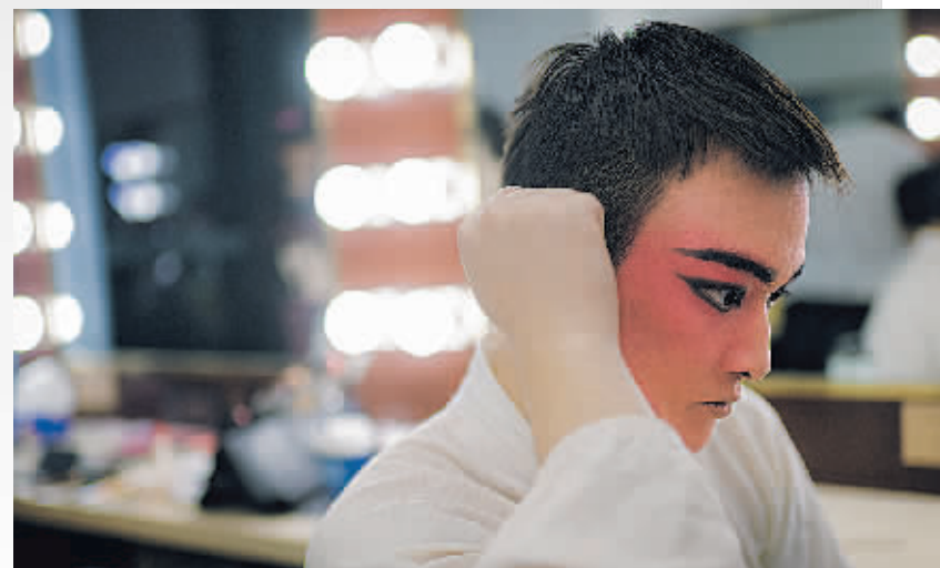
楚剧年轻演员在后台做准备。