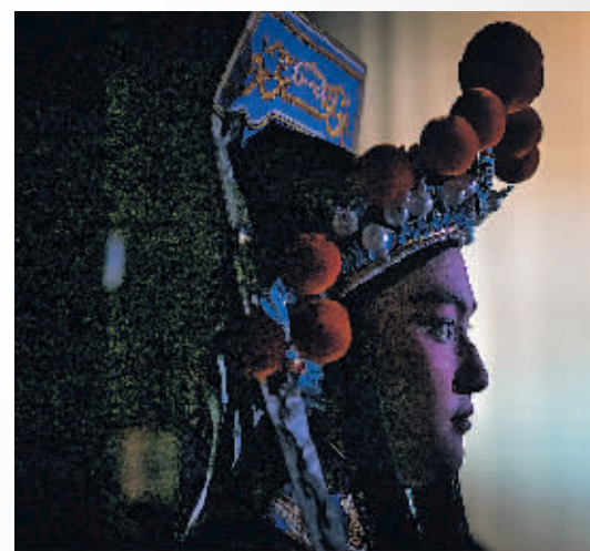
楚剧《秦琼表功》剧照。