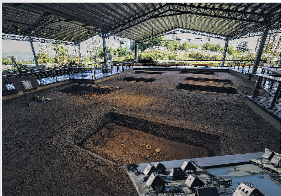
良渚古城遗址公园内的反山遗址。