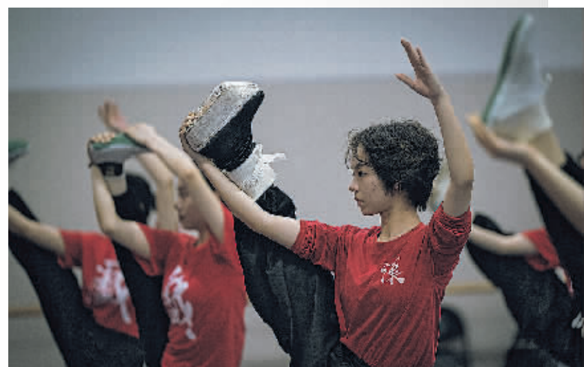
汉剧年轻演员在练功。