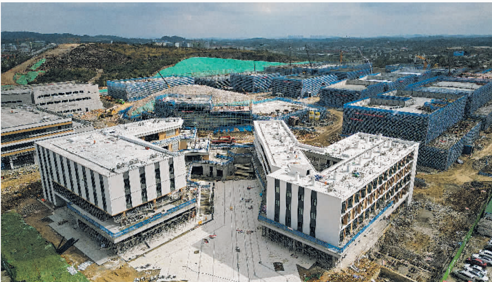
11月26日，在东数西算贵安算力产业集群配套项目一期施工现场，大型机械穿梭作业，工人在各楼栋加紧施工，一片热火朝天的建设景象。该项目占地面积200余亩，分为起步区、发展区、拓展区进行开发建设，有23栋单体建筑，部分楼栋已经封顶，预计明年3月底达到交付条件。其中，起步区的建设内容包括大型厂房、中型厂房、生活配套等设施，项目建成运营达产后，将入驻各类智能制造企业20余家。