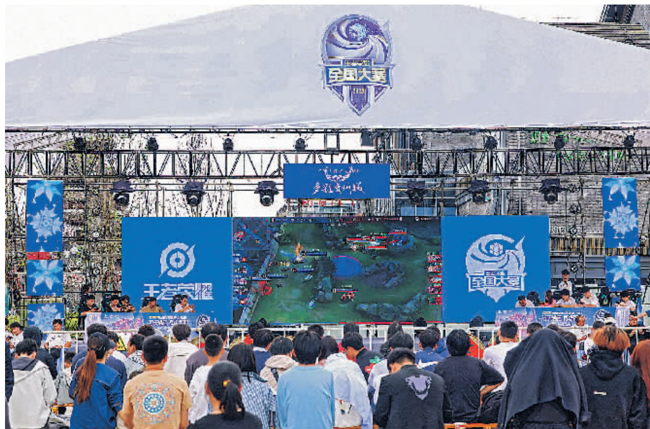
4月20日,比赛现场人头攒动。

1000万人,以18岁到40岁人群为主,部分项目水平在全国达中上游,省市协会的部分会员单位还曾获得世界级比赛总冠军。”赵乔奇说。