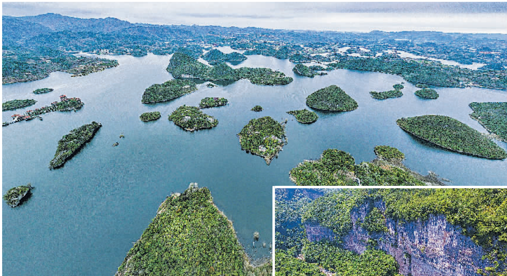
俯瞰百花湖。

本报讯 记者4月22日从市林业局获悉,贵阳贵安9个省级风景名胜区(贵阳8个、贵安1个)总体规划全部获省政府批复,批复总面积740.62平方公里,占贵阳贵安国土面积的8.86%。