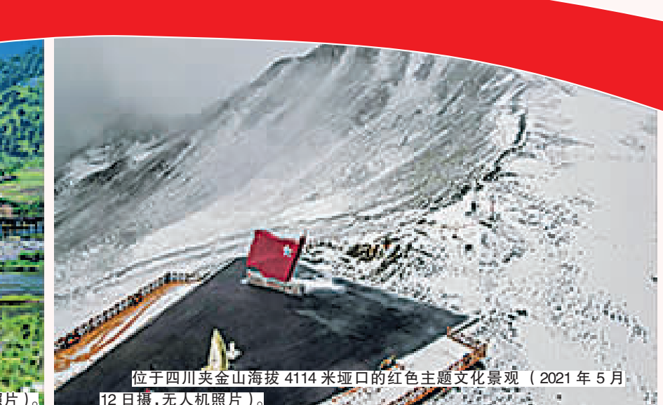
位于四川夹金山海拔4114米垭口的红色主题文化景观(2021年5月12日摄,无人机照片)。